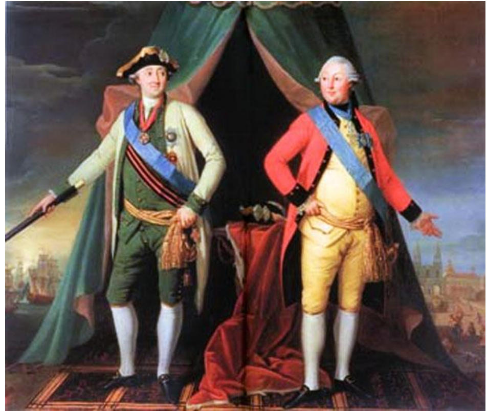
А. Г. Орлов и Г.Г. Орлов

— русский военный и государственный деятель, генерал-аншеф, сподвижник Екатерины II, брат её фаворита Григория Григорьевича Орлова.