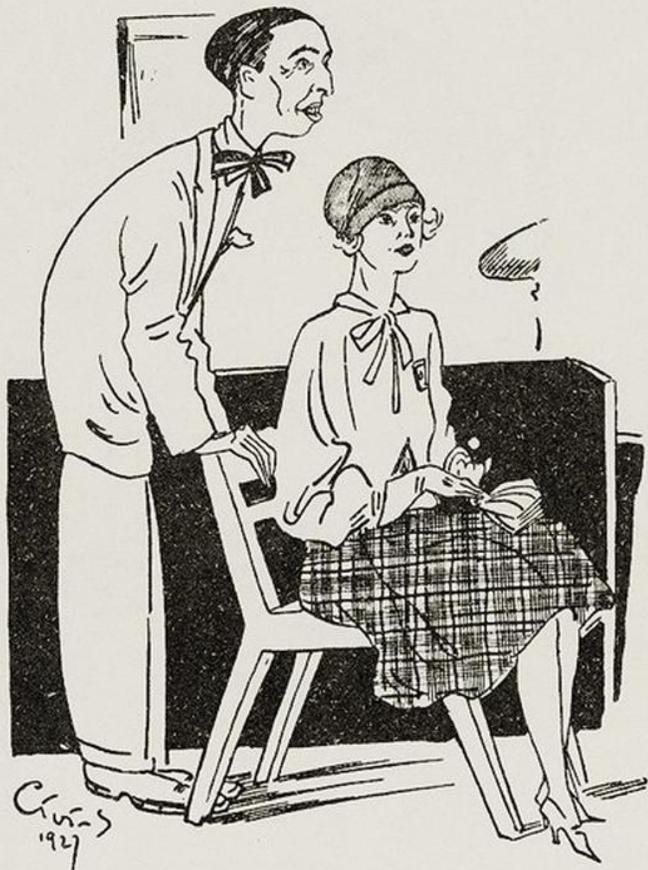
Георгій Ивановъ и Ирина Одоевцева. (Писатель Георгій Ивановъ и его жена писательница Ирина Одоевцева, проведя лето подъ Ригой, сегодня возвращаются въ Парижъ). Шаржъ Civis'а.