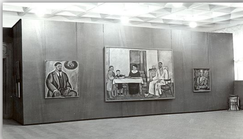
Выставка "Автопортрет в русском и советском искусстве". 1976-1977