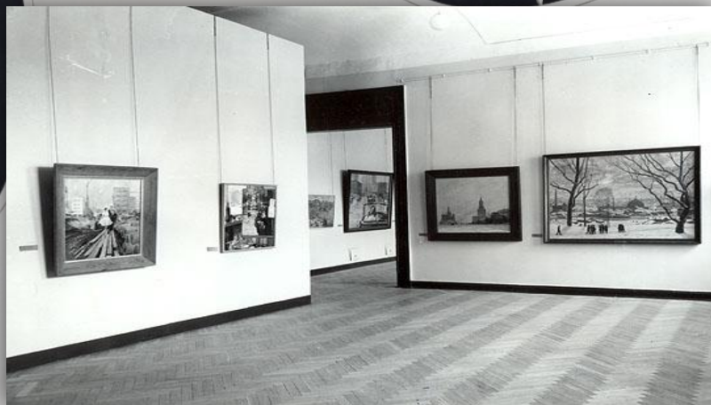
Экспозиция выставки "Москва в русской и советской живописи". 1980