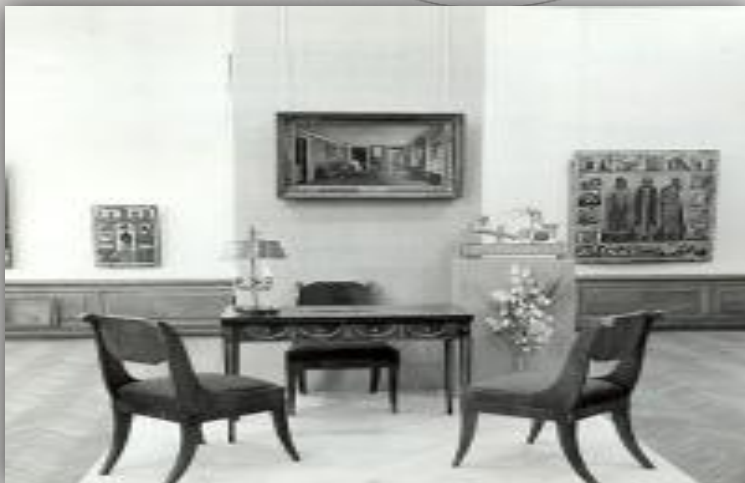
Экспозиция выставки "Интерьер в творчестве русских и советских художников". 1980