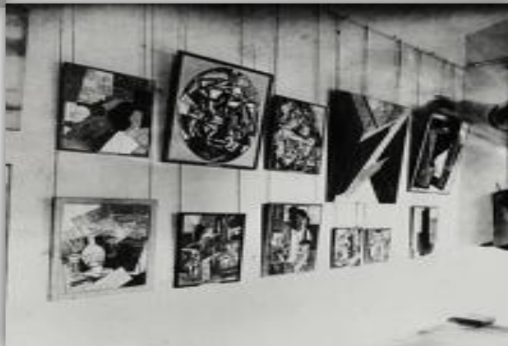
Выставка новейшей живописи. 1930