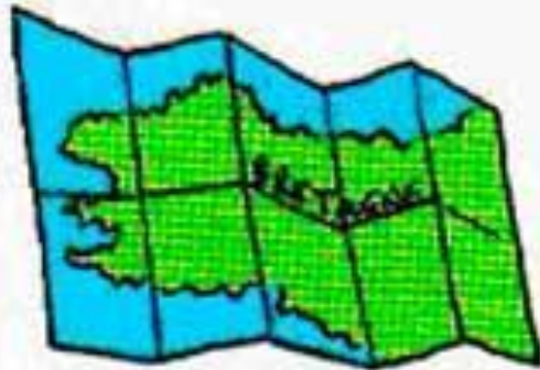
une carte de la région