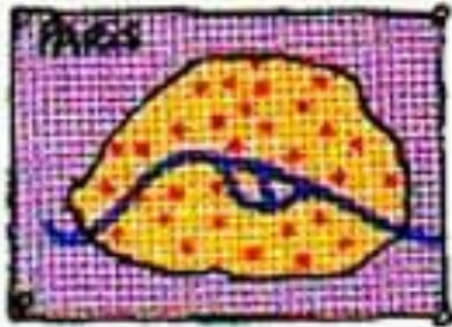
un plan de la ville