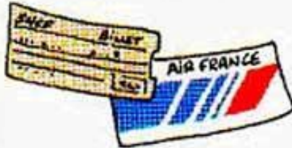
les billets (de train, d'avion...)