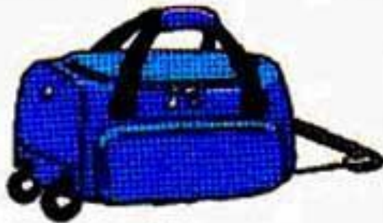
un sac de voyage