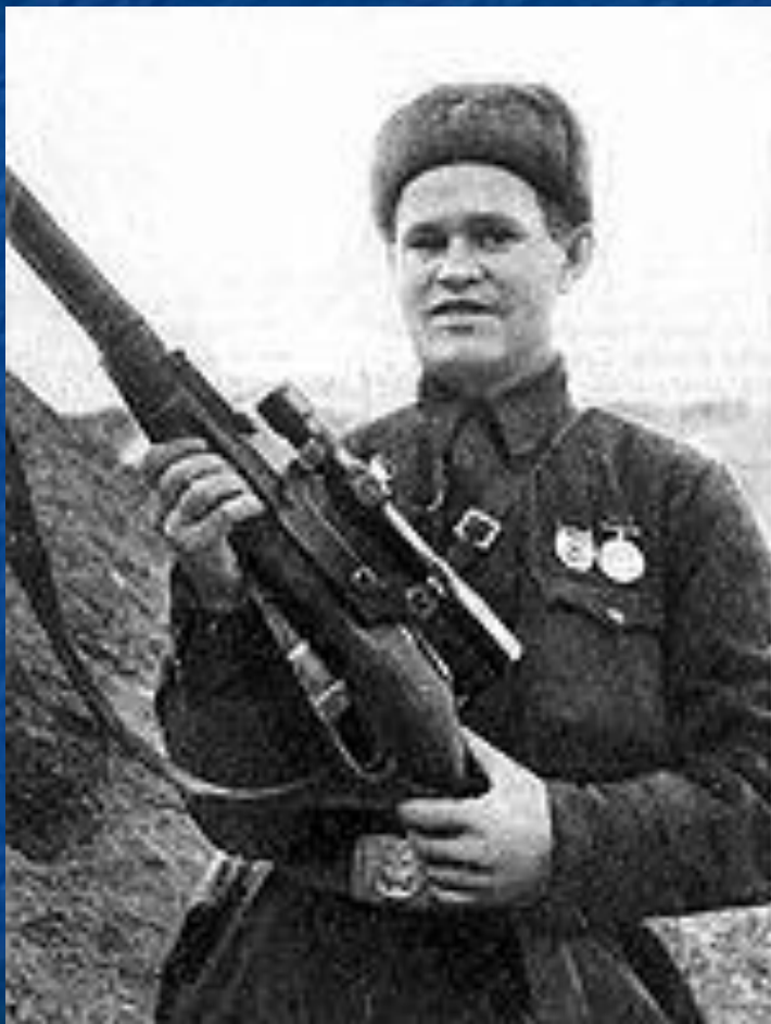
Герой Советского Союза, снайпер Зайцев Василий Григорьевич

Уже в первых схватках с врагом Зайцев показал себя незаурядным стрелком. В Зайцеве сочетались все качества, присущие снайперу, — острота зрения, чуткий слух, выдержка, хладнокровие, выносливость, военная хитрость. Он умел выбирать самые лучшие позиции, маскировать их; обычно скрывался от вражеских солдат там, где они не могли и предполагать русского снайпера. Прославленный снайпер бил врага беспощадно. Только в период с 10 ноября по 17 декабря 1942 года в боях за Сталинград В. Г. Зайцев уничтожил 225 солдат и офицеров противника, в том числе 11 снайперов , а его товарищи по оружию в 62-й армии — 6000. Особенно прославил Зайцева снайперский поединок с начальником берлинской школы снайперов, майором Кёнингом.