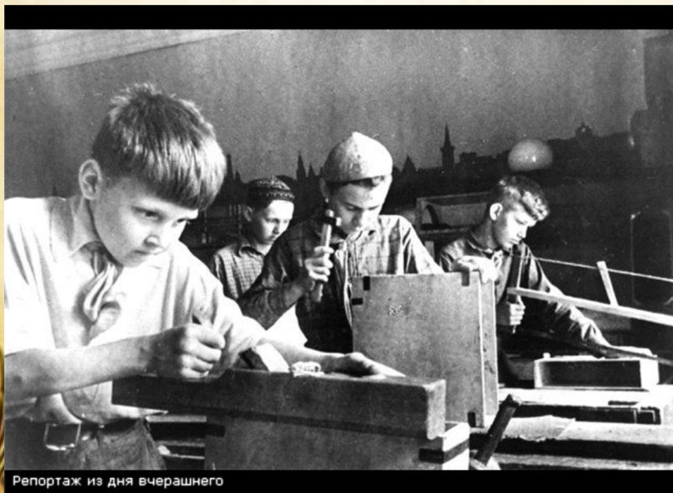
Репортаж из дня вчерашнего

Смертельная угроза нависла над нашей Родиной. Все, кто мог воевать, пошли на фронт. Остальные помогали армии в тылу, обеспечивая её продовольствием, снаряжением и боеприпасами.