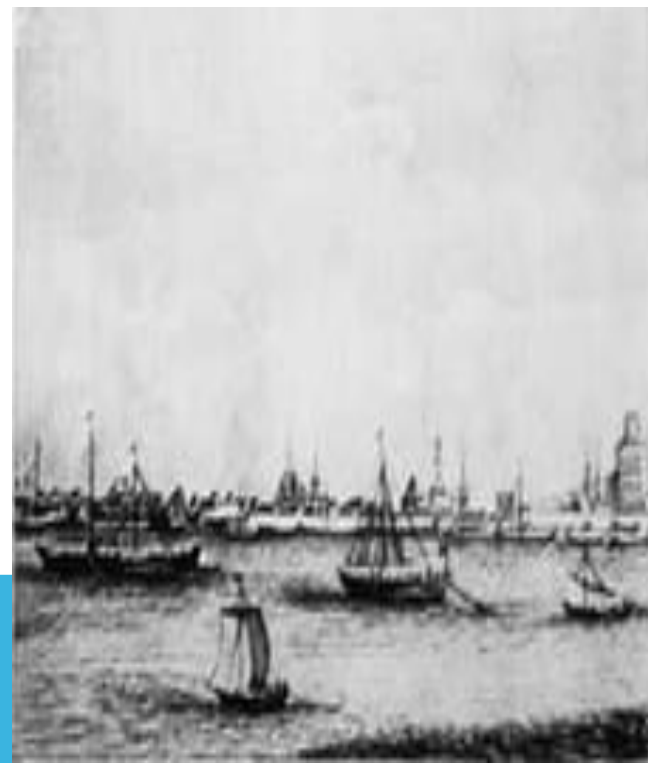
Астрахань. Гравюра начала XVIII века.

Вскоре восстание охватило нижнее Поволжье и часть