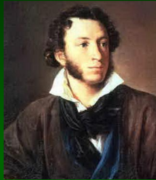
А.С.Пушкин (1799 – 1837)

Летом 1831 года Жуковский и Пушкин вступили в своеобразное «состязание»: кто лучше напишет сказку, подобную народной.