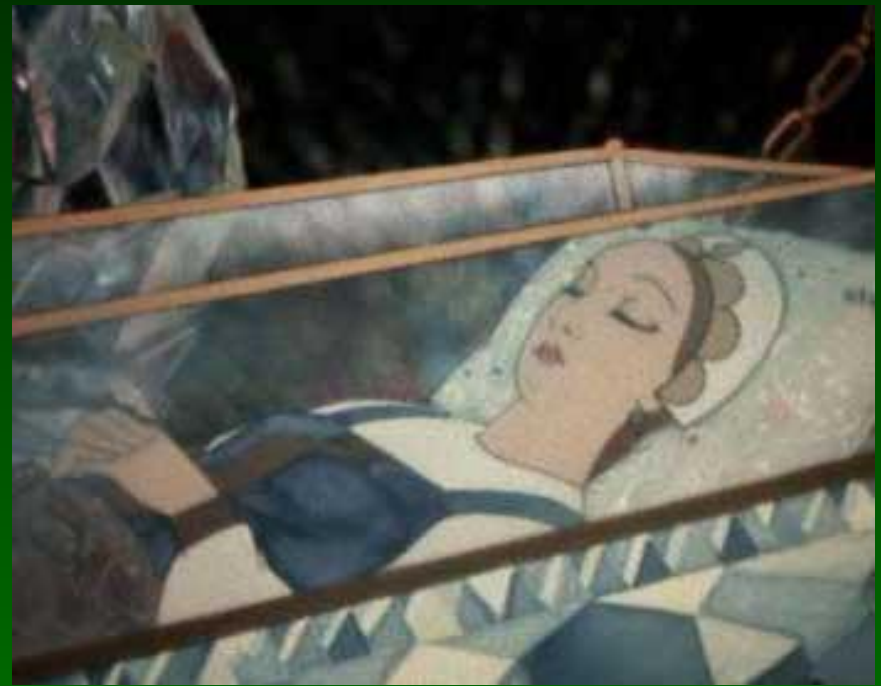
«Сказка о мертвой царевне и семи богатырях»

Сказки Пушкина и Жуковского написаны в стихотворной форме.