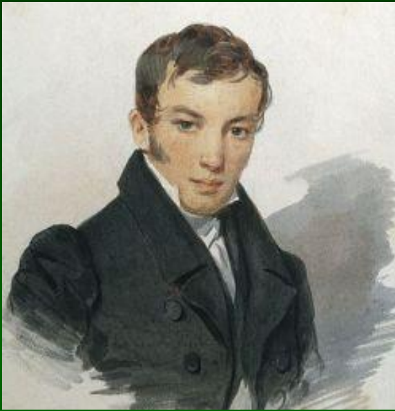
В.А.Жуковский (1783 – 1852)