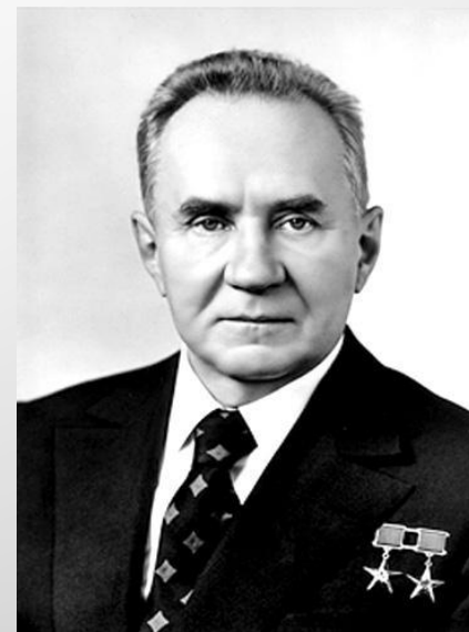
А. Н. Косыгин