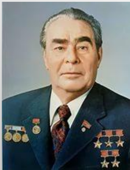
Л. И. Брежнев

НА ОКТЯБРЬСКОМ 1964 Г. ПЛЕНУМЕ ЦК КПСС ПРОИЗОШЛА СМЕНА РУКОВОДСТВА СТРАНЫ. ПЛЕНУМ ОСВОБОДИЛ Н. С. ХРУЩЕВА ОТ ОБЯЗАННОСТЕЙ ПЕРВОГО СЕКРЕТАРЯ ЦК ПАРТИИ. ИМ СТАЛ Л. И. БРЕЖНЕВ, ГЛАВОЙ ПРАВИТЕЛЬСТВА — А. Н. КОСЫГИН.