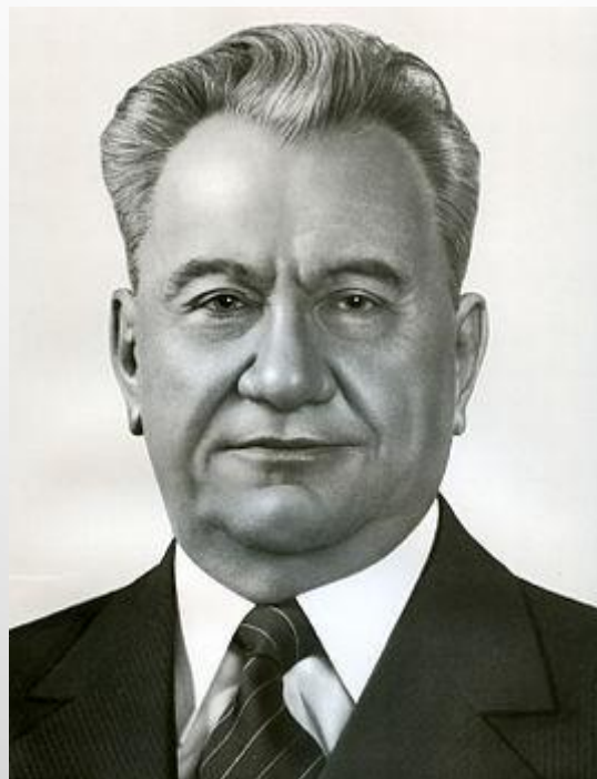
Кунаев Динмухамед Ахмедович