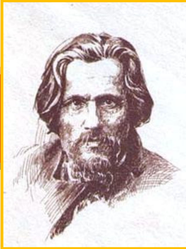
Спиридон Дмитриевич Дрожжин (1848-1930)