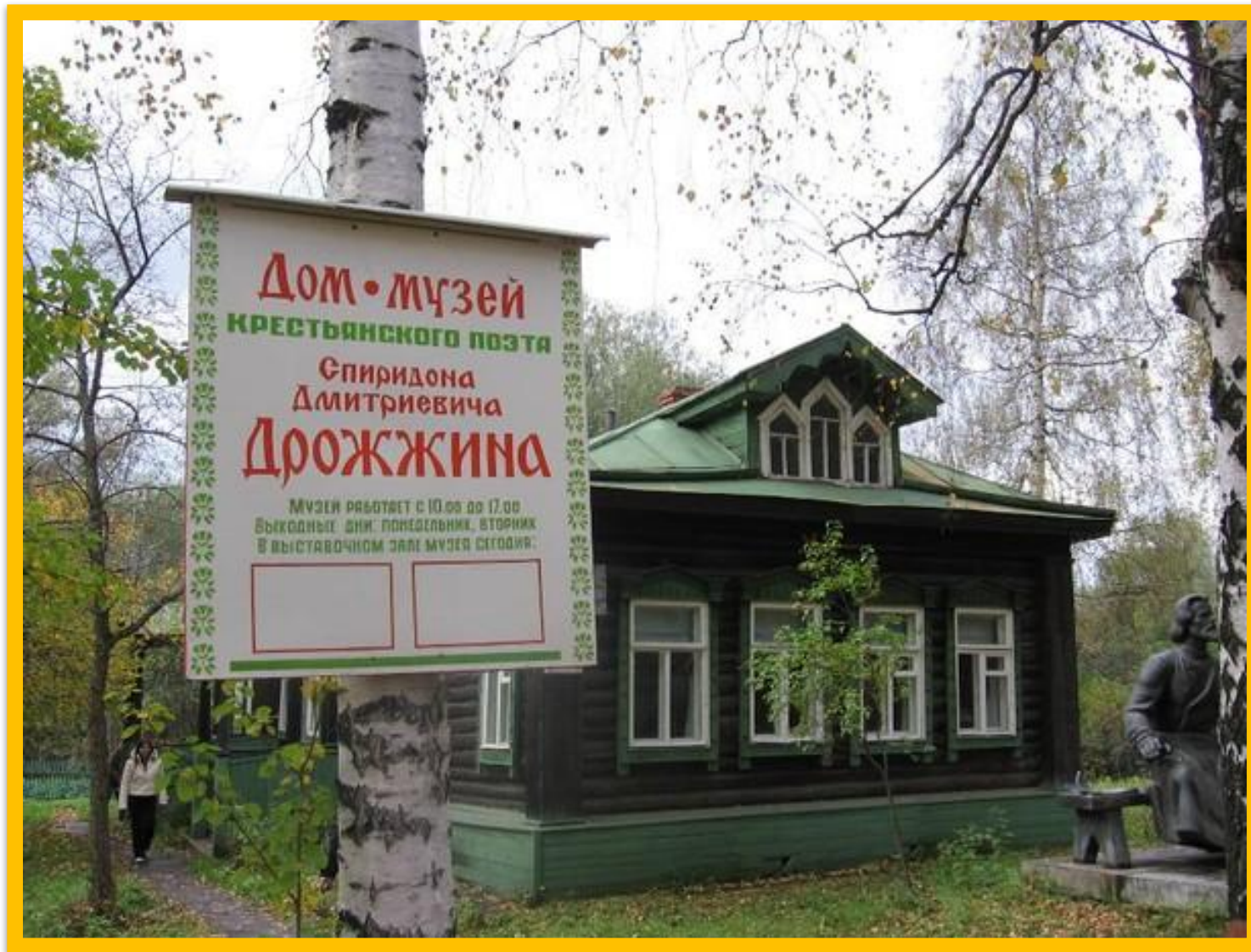
Музей Спиридона Дмитриевича Дрожжина расположен на станции Завидово, открыт для посетителей в 1938 году.