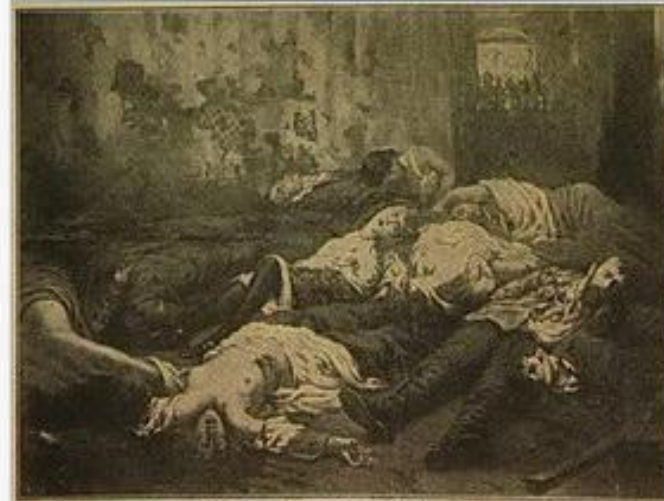
ЕКАТЕРИНБУРГСКОЕ ЗЛОДЬЯНИЕ. — 17 июля 1918 г.