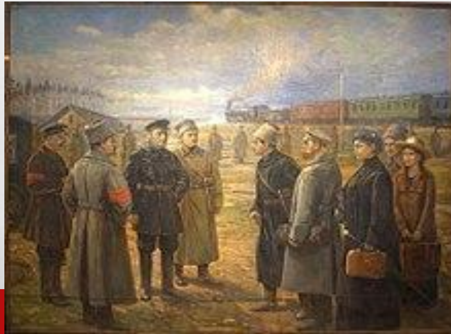
ПЕРЕЕЗД НА УРАЛ