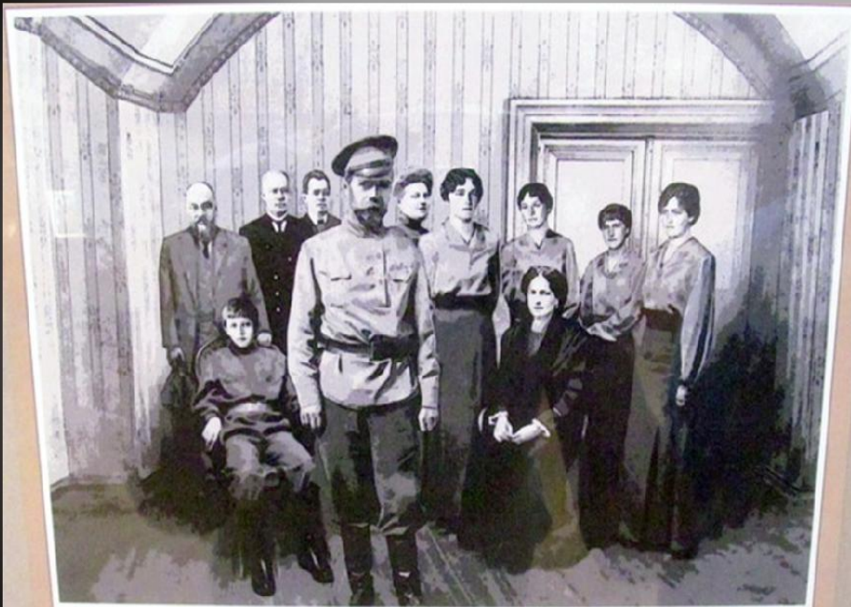
«Перед расстрелом», фотореконструкция.