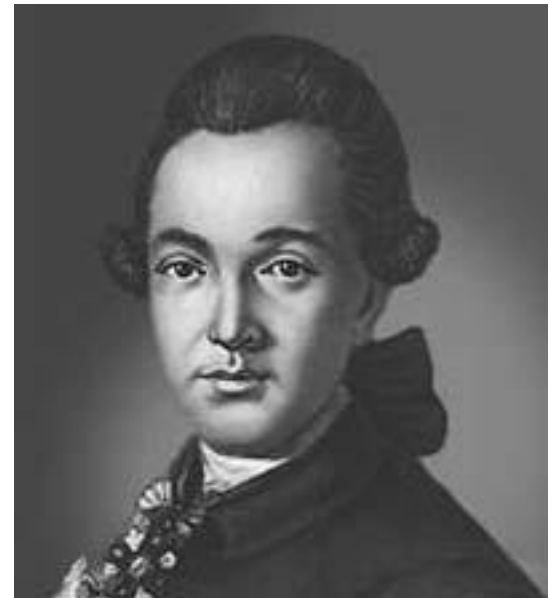
М.Ф. Казаков (1738 – 1812)