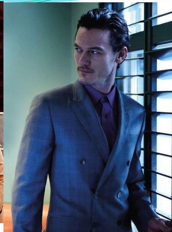
Luke Evans - Актёр