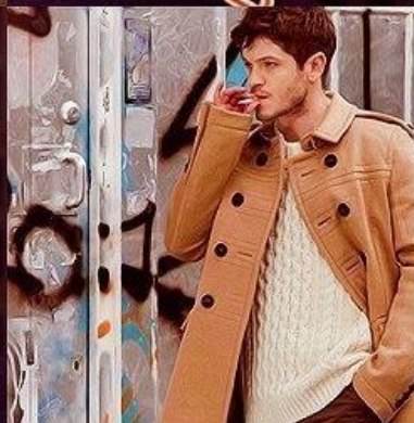
Iwan Rheon – Әнші, әрі өзі де ән жазады