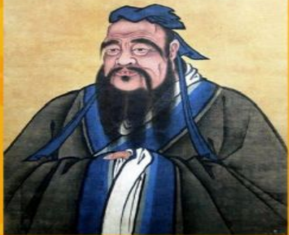
Конфуций(Кун-фу-цзы) « ұстаз-кун»

Конфуций ілімі адамды бірінші әлуметтік өмірдің мүшесі ретінде қарастыратын ежелгі философиялық мектеп.