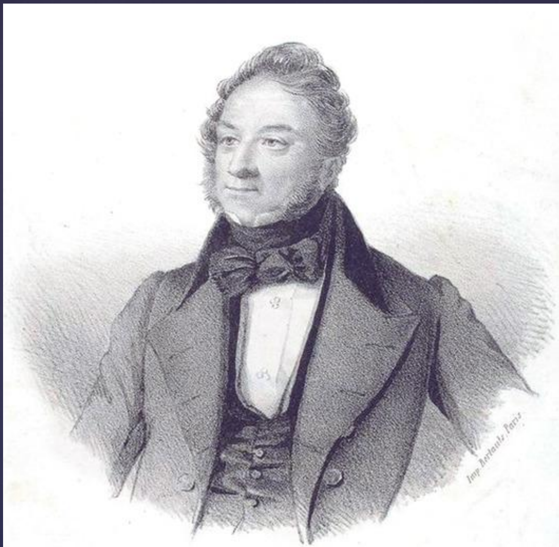
Кавос Альберт Катеринович (1800-1863)