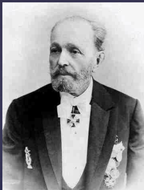
М. И. Петипа