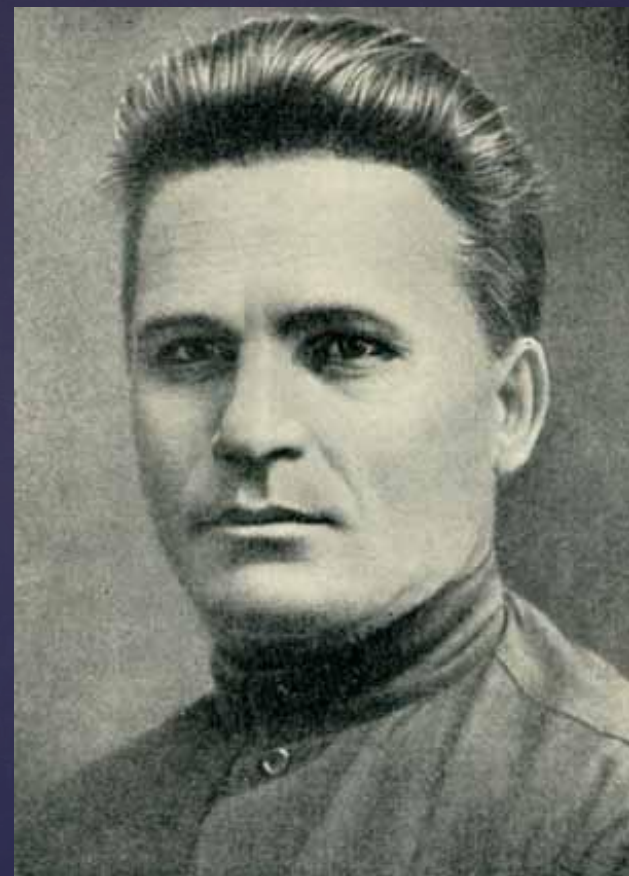
С. М. Киров