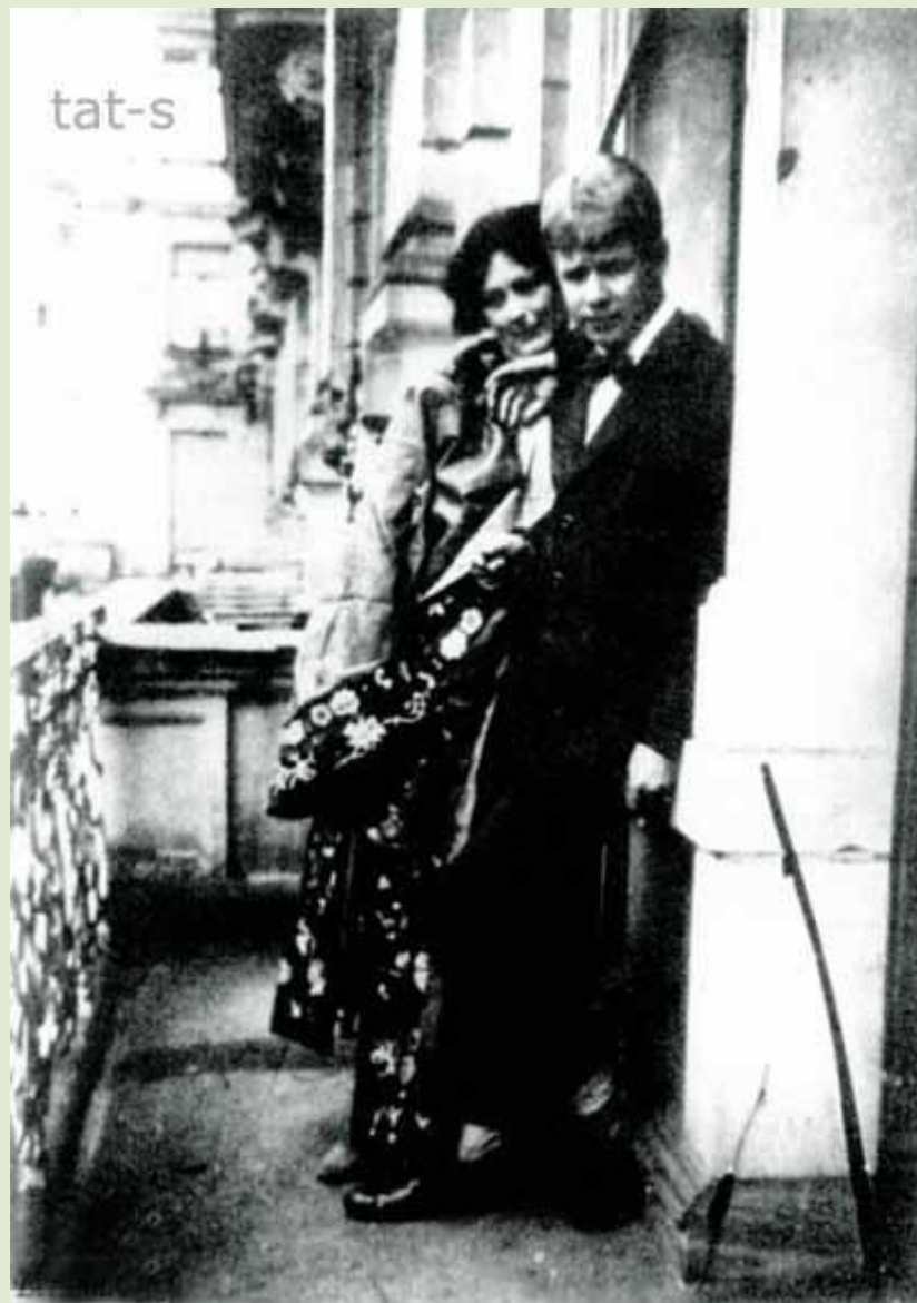
Сергей Есенин и Айседора Дункан, на улицах Венеции. Фото - август 1922 год.