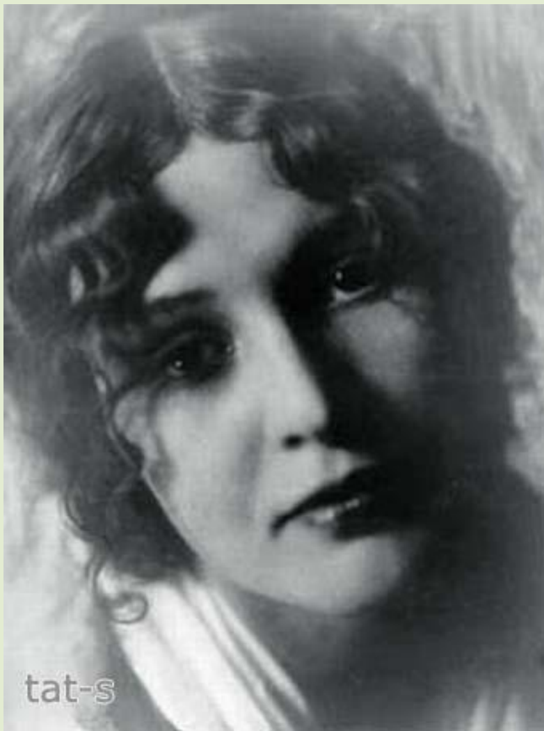
Жена Есенина, актриса - Зинаида Николаевна Райх (1894 - 1939)

30 июля 1917 года Есенин (21 год) обвенчался актрисой Зинаидой Райх в церкви Кирика и Улиты Вологодского уезда.