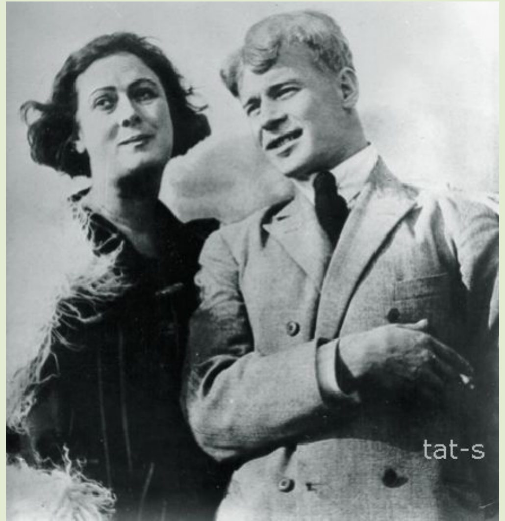
Сергей Есенин и Айседора Дункан – Берлин, 1922 год.