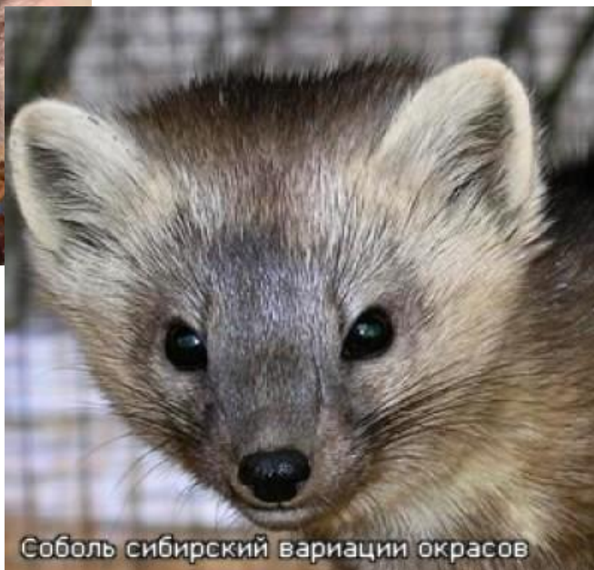
Соболь сибирский вариации окрасов