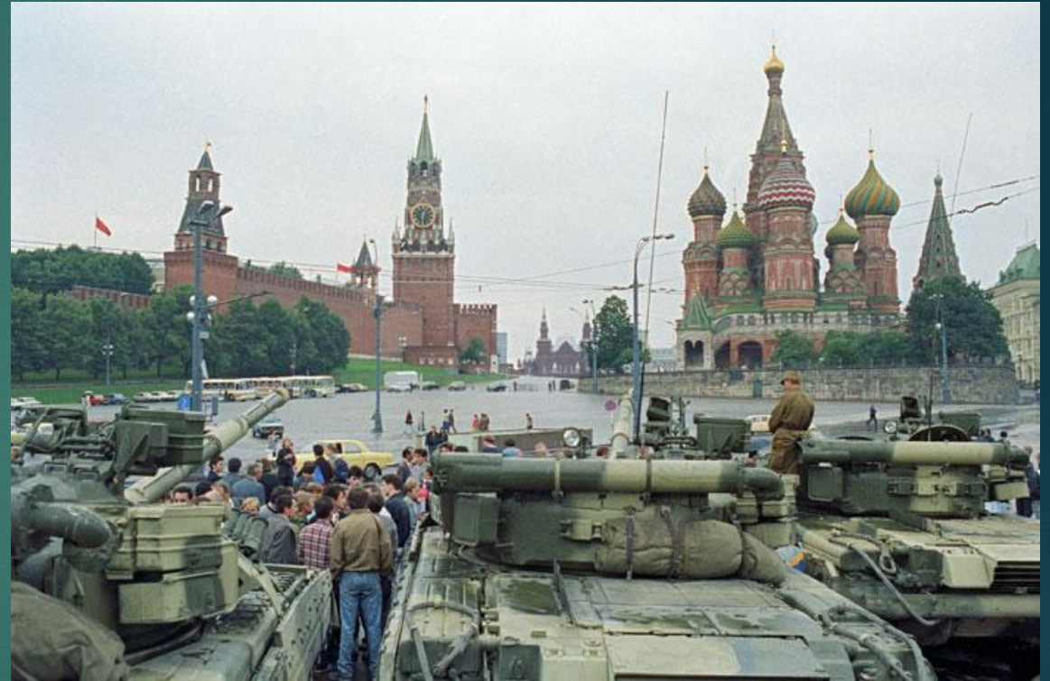
Мәскеуге еңгізілген әскерлер