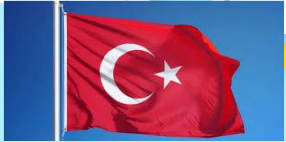
Turkey |'tə:ki| Турция