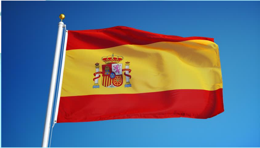
Spain |spreɪn| Испания