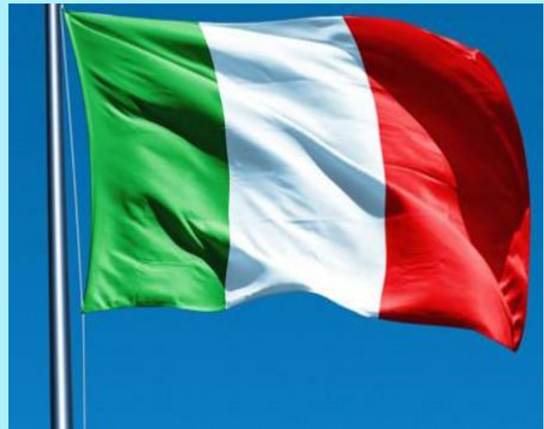
Italy |'ɪtəli| Италия