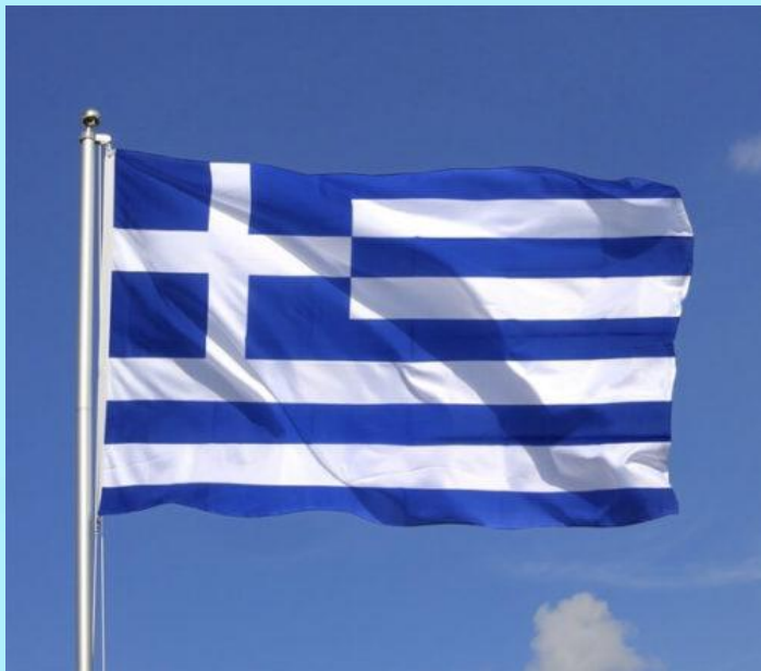
Greece |grɪːs| Греция

Учебник с. 122 №1. Послушайте аудиозапись, прочитайте названия стран и перепишите к себе в тетрадь названия стран с транскрипцией и переводом.