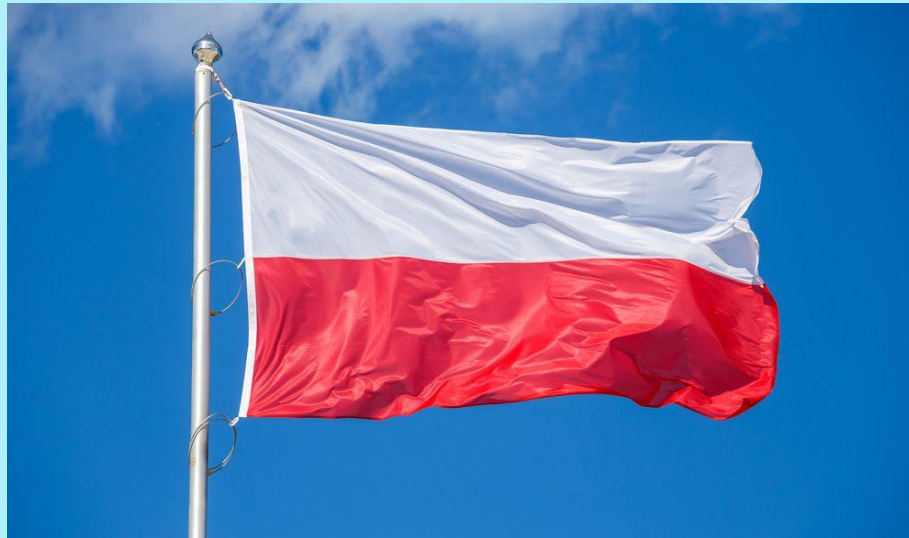
Poland |'rəʊlənd| Польша