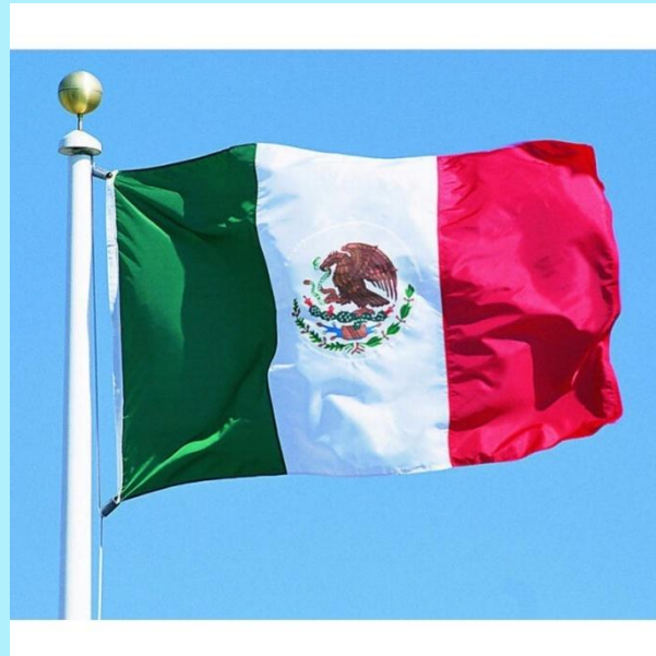
Mexico | 'mɛksɪkəʊ| Мексика