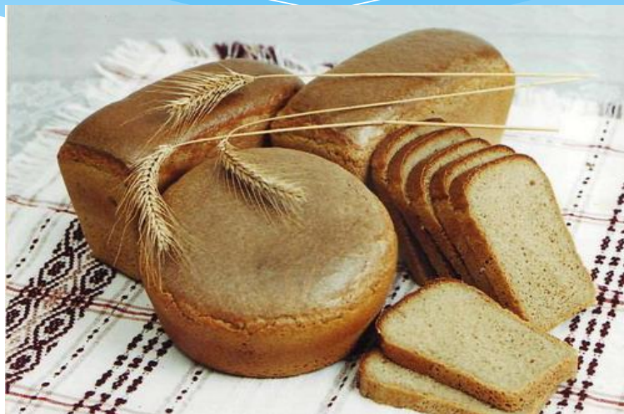
Свежий хлеб - ...