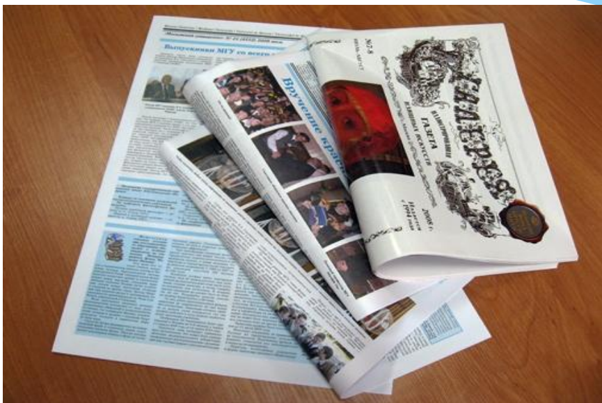
Свежая газета - ...