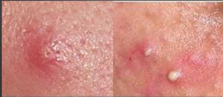
Рис. 2 - Пустулы