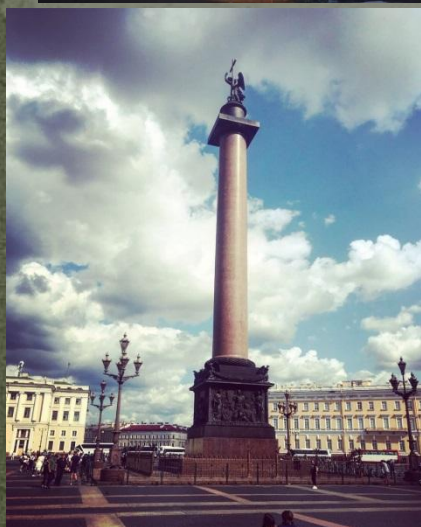
- Александрийский столп (Александровская колонна)