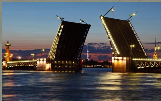
- Разводные мосты