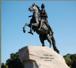
- Памятник Петру I - 18 августа 1782 года