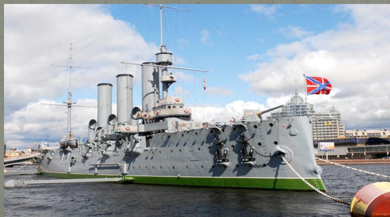
- Крейсер Аврора