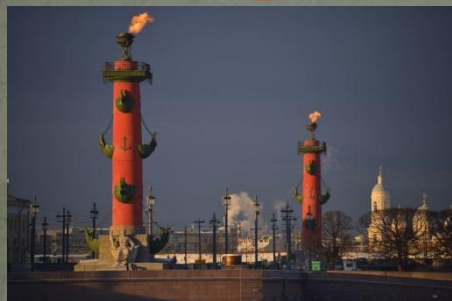
- Ростральные колонны