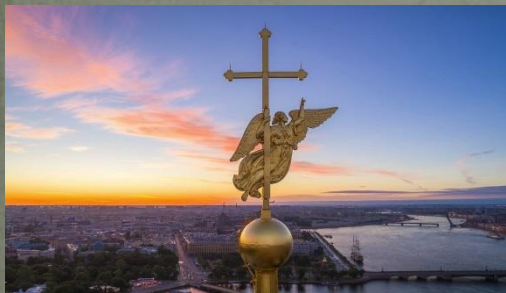
- Ангел на шпиле Петропавловского собора