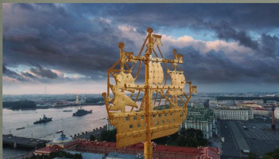
- Кораблик на шпиле Адмиралтейства