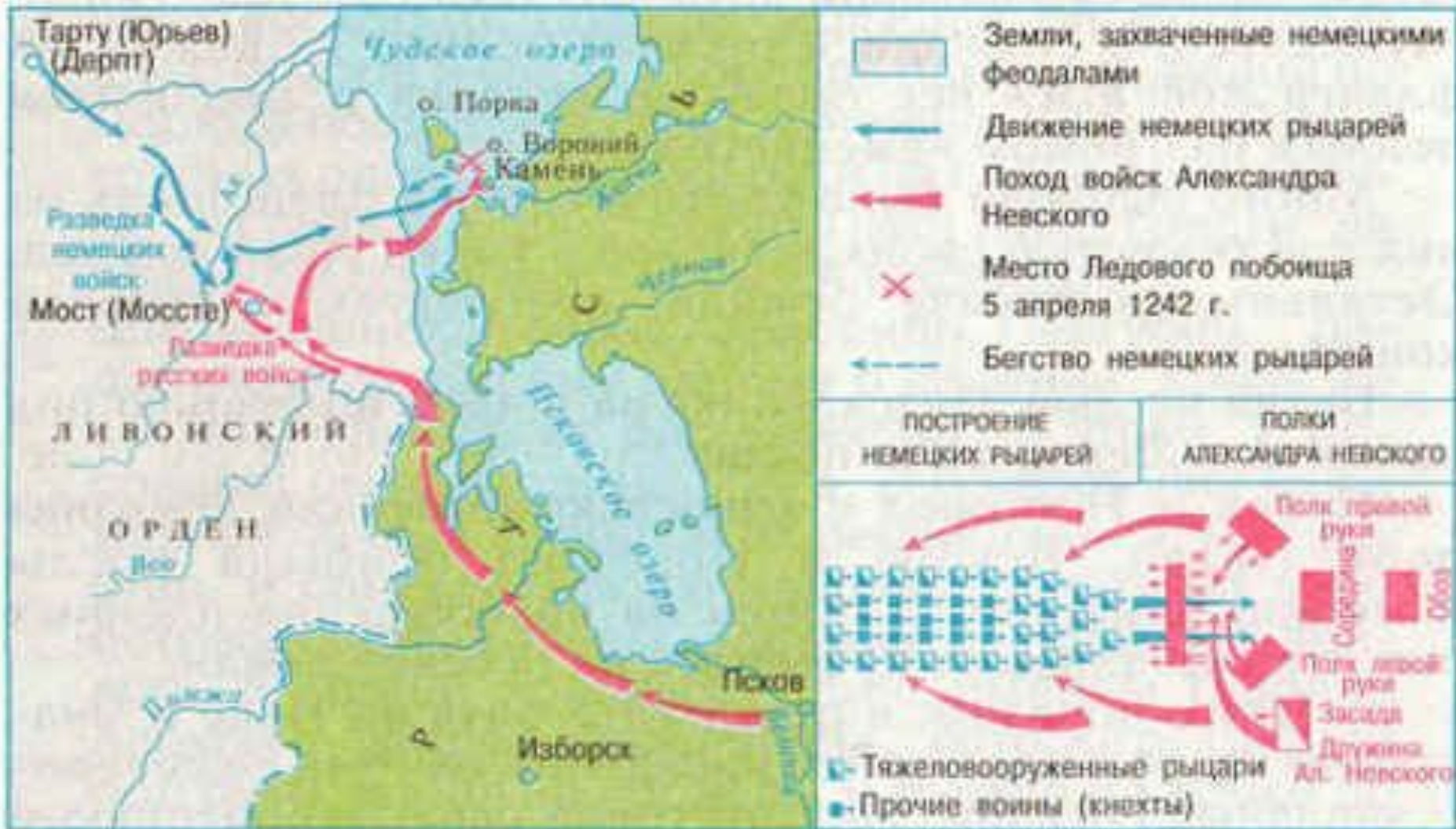
Движение войск и Ледовое побоище.