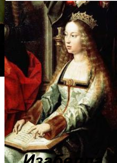
Изабелла Кастильская ая