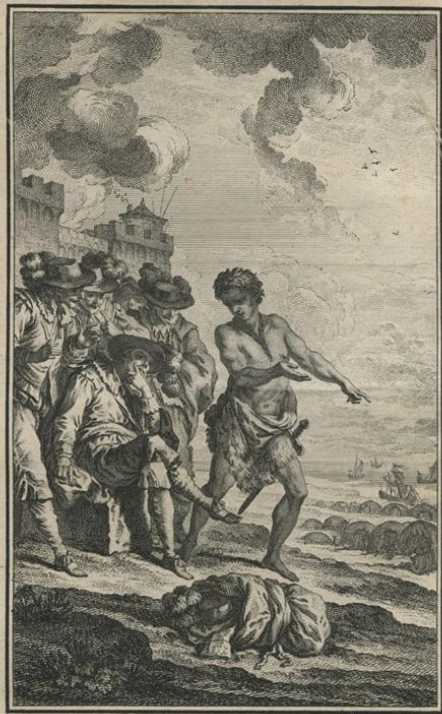
S. Goussier del. J. B. de la Motte sculp. Il retourne chez les Egaux. Voyez la Note 13. p. 259.