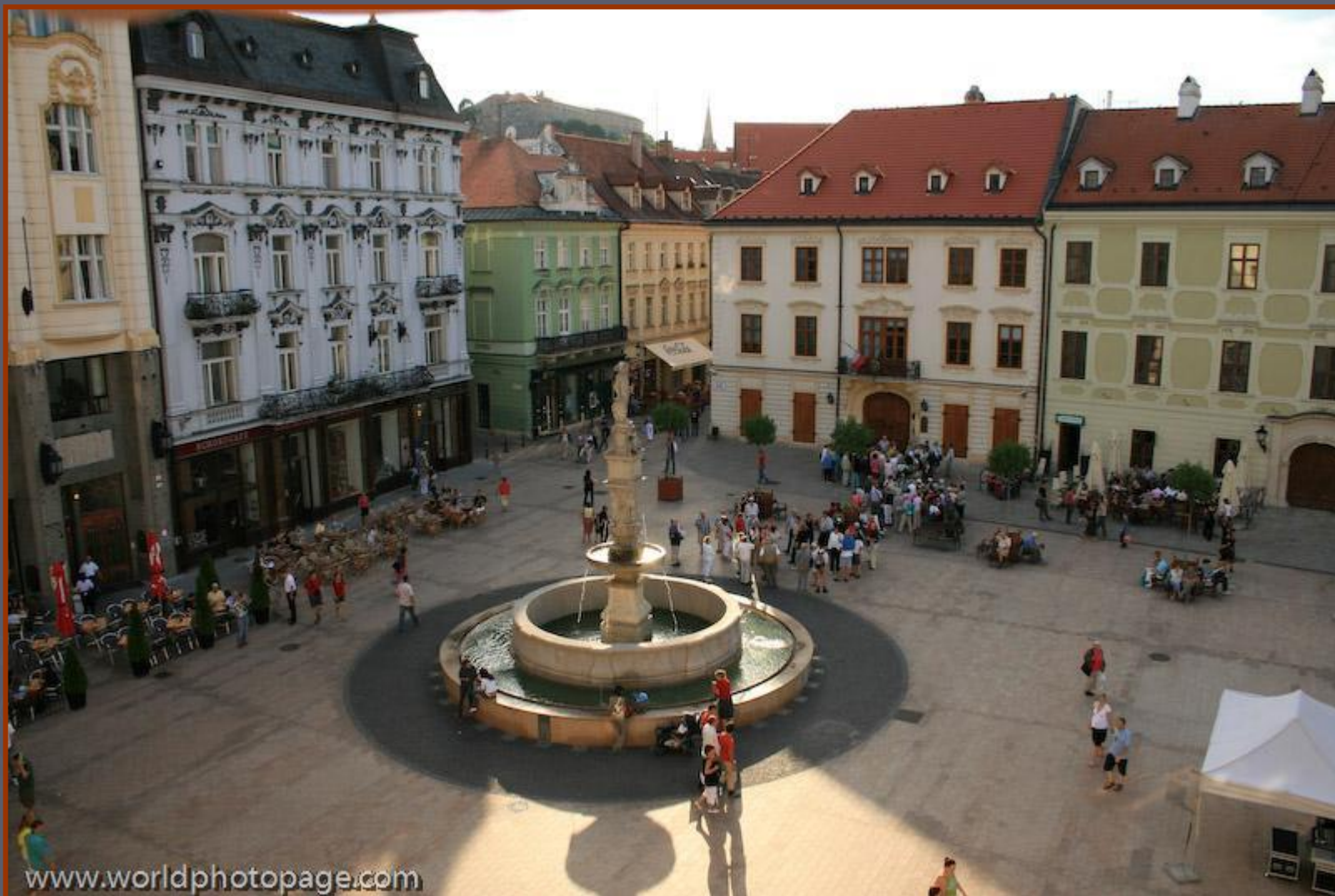
Фонтан на центральной площади средневекового города