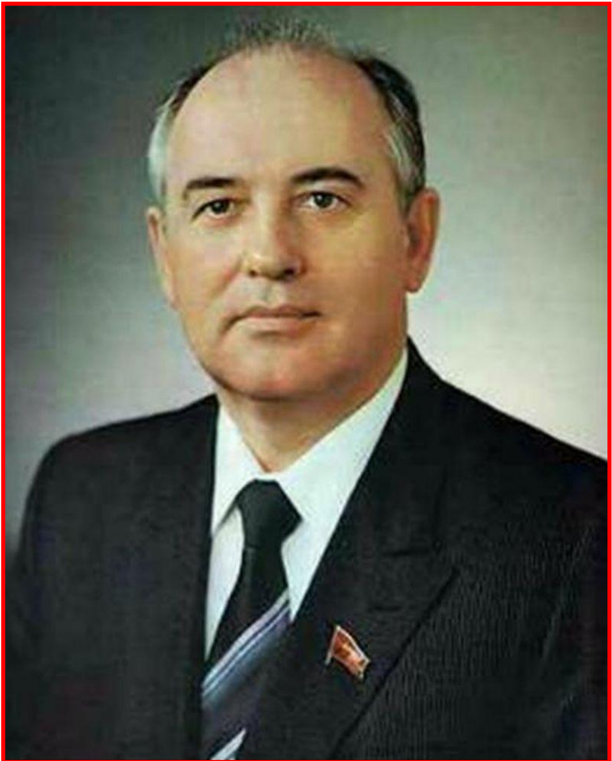
Михаил Сергеевич Горбачев