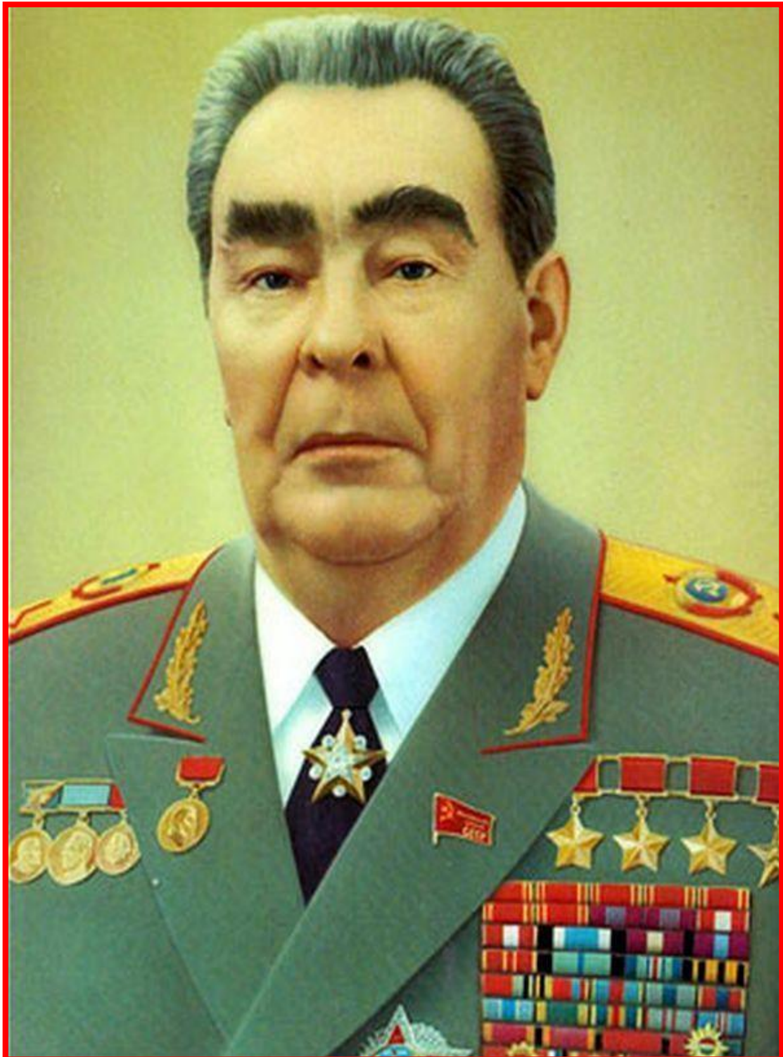
Леонид Ильич Брежнев