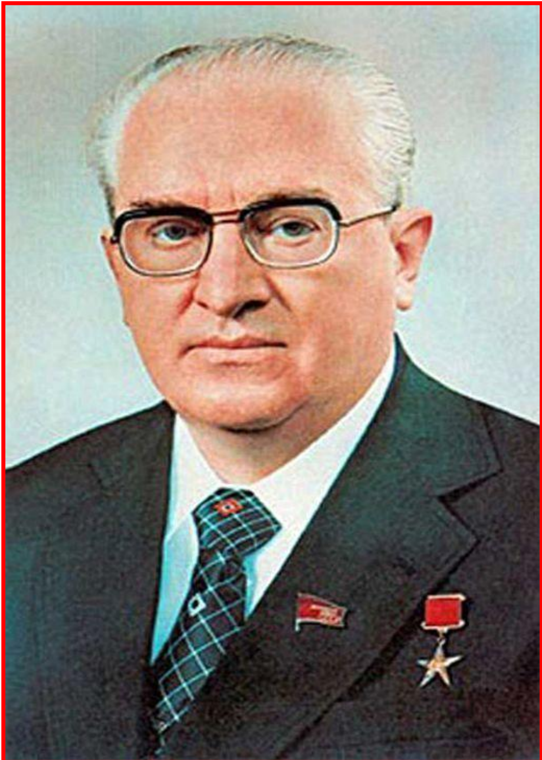
Юрий Владимирович Андропов