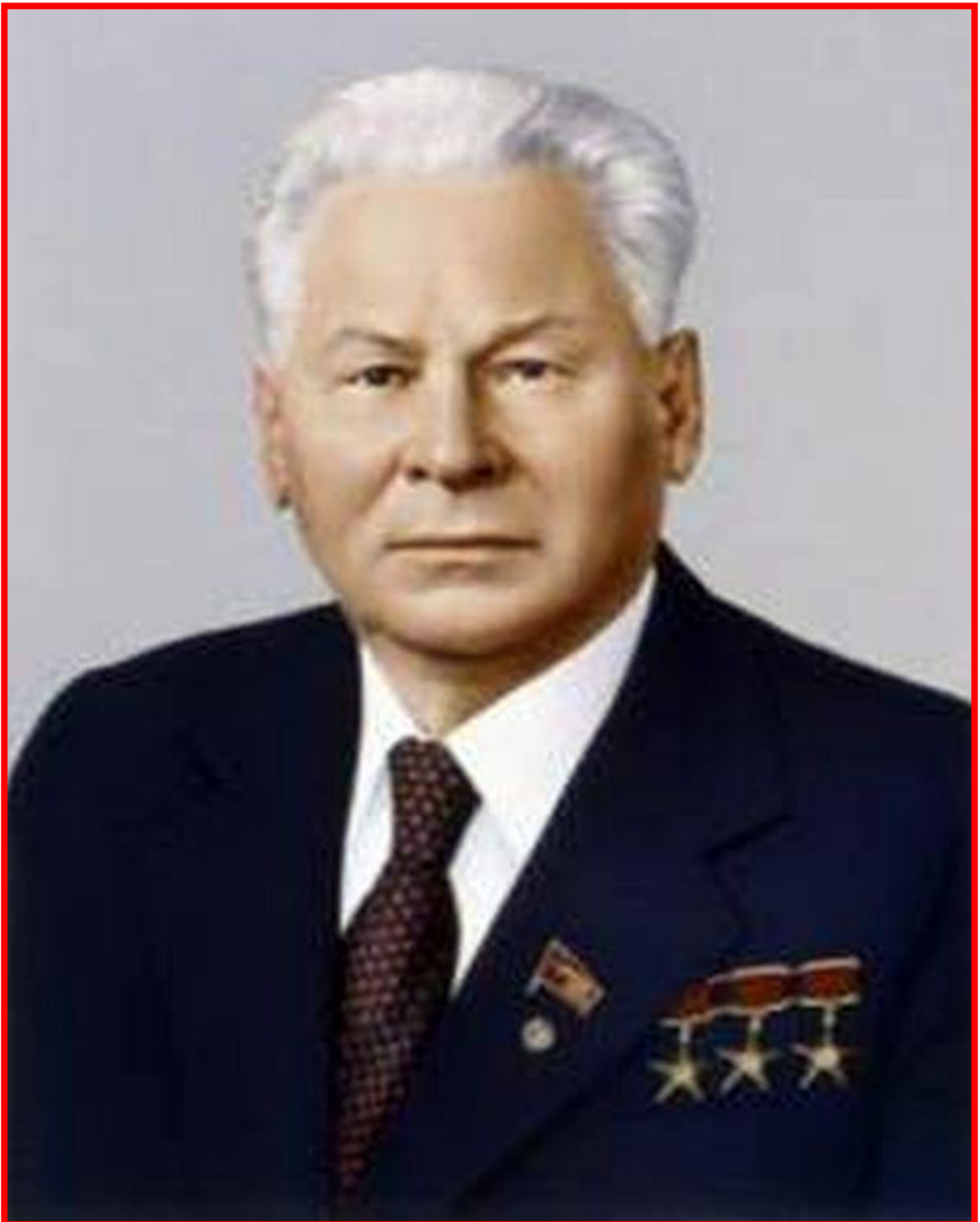
Константин Устинович Черненко