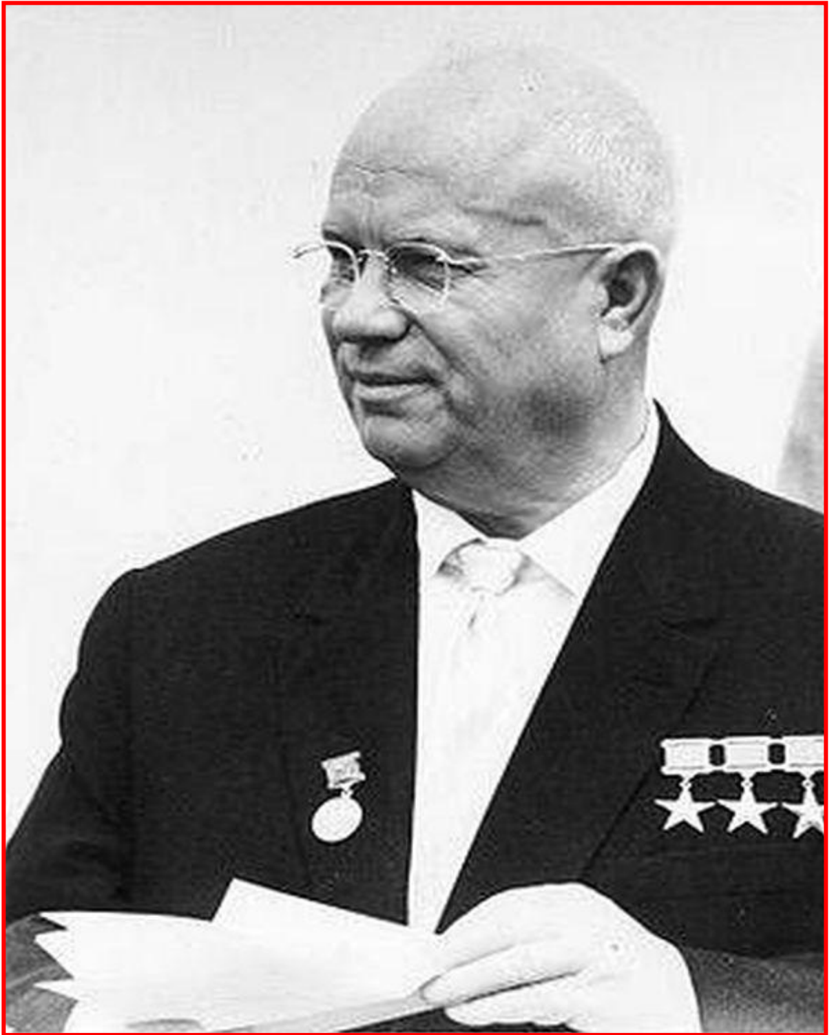
Никита Сергеевич Хрущев