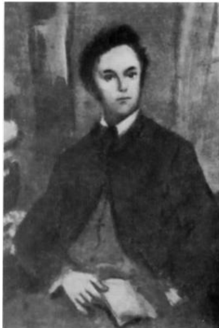
«Отцы и дети». Аркадий Кирсанов. Иллюстрация К. И. Рудакова. 1947 г.