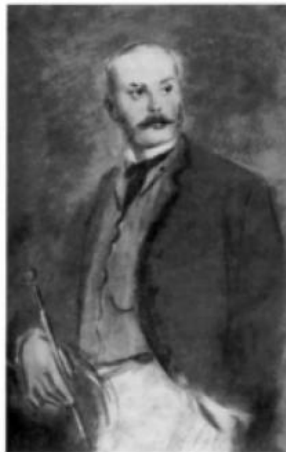
«Отцы и дети». Павел Петрович Кирсанов. Иллюстрация К. И. Рудомова, 1946—1947 гг.