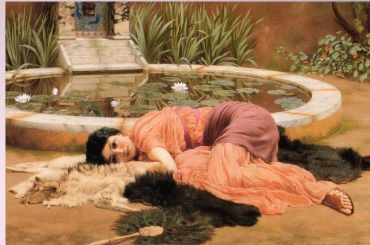
Джон Вільям Годвард, «Солодке неробство» (1904)

Прогрес – це розвиток від нижчого до вищого, поступовий рух до кращого. Лінь – це відсутність бажання робити щось, будь-яку роботу, такий стан душі і тіла, коли наше «повинен» не відповідає нашому «хочу».