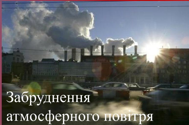
Забруднення атмосферного повітря