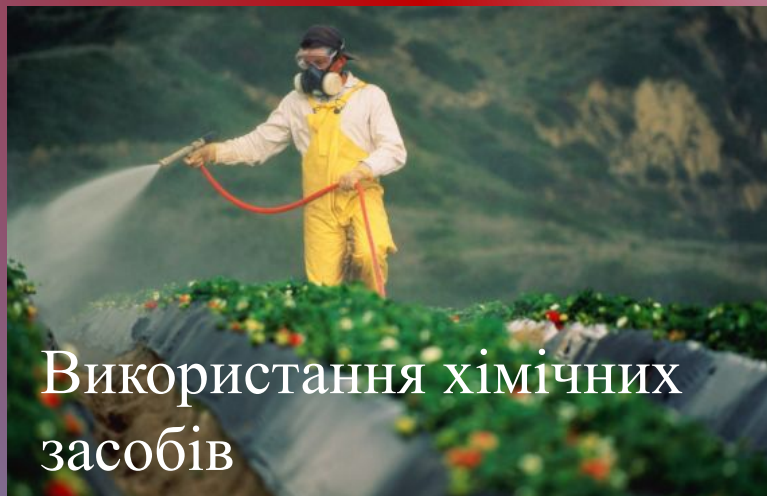
Використання хімічних засобів