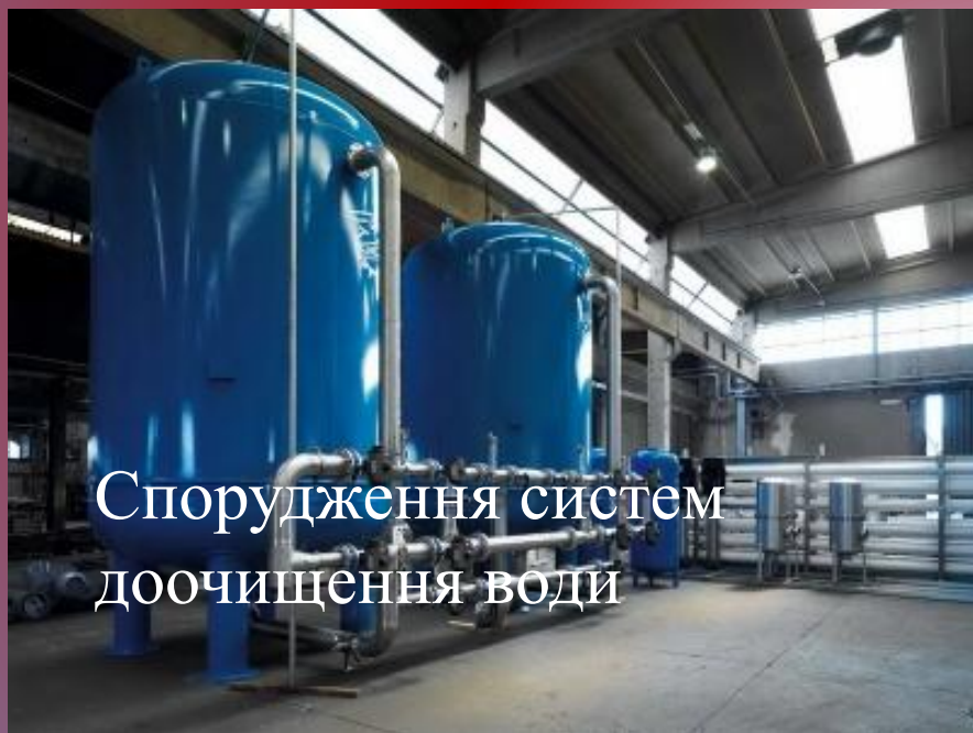
Спорудження систем доочищення води