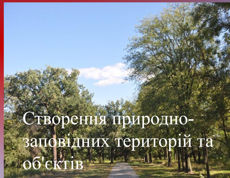
Створення природно-заповідних територій та об'єктів