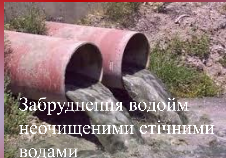
Забруднення водою неочищеними стічними водами