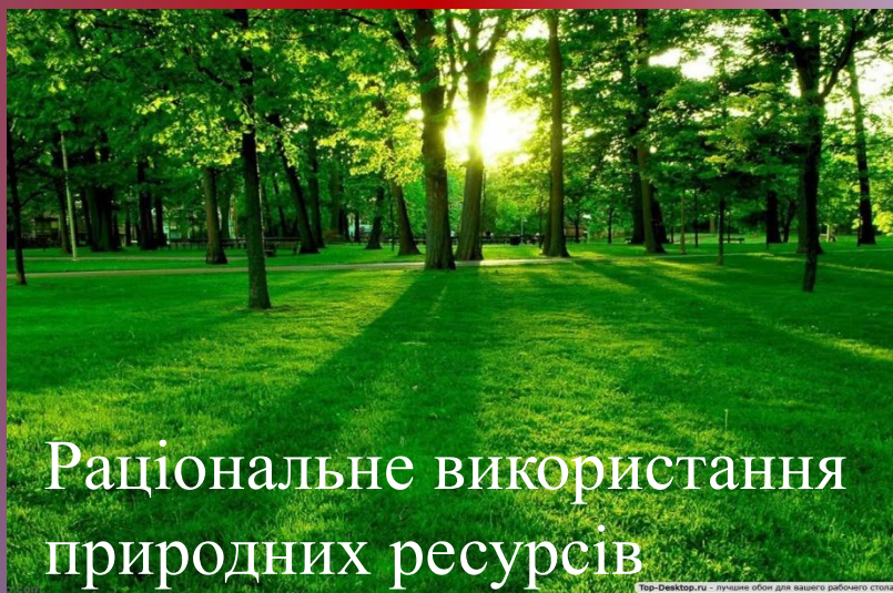
Раціональне використання природних ресурсів