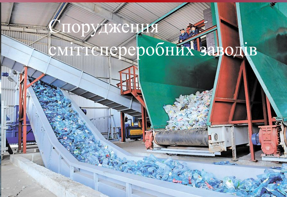
Спорудження сміттєпереробних заводів