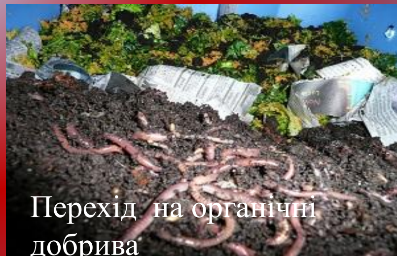
Перехід на органічні добрива