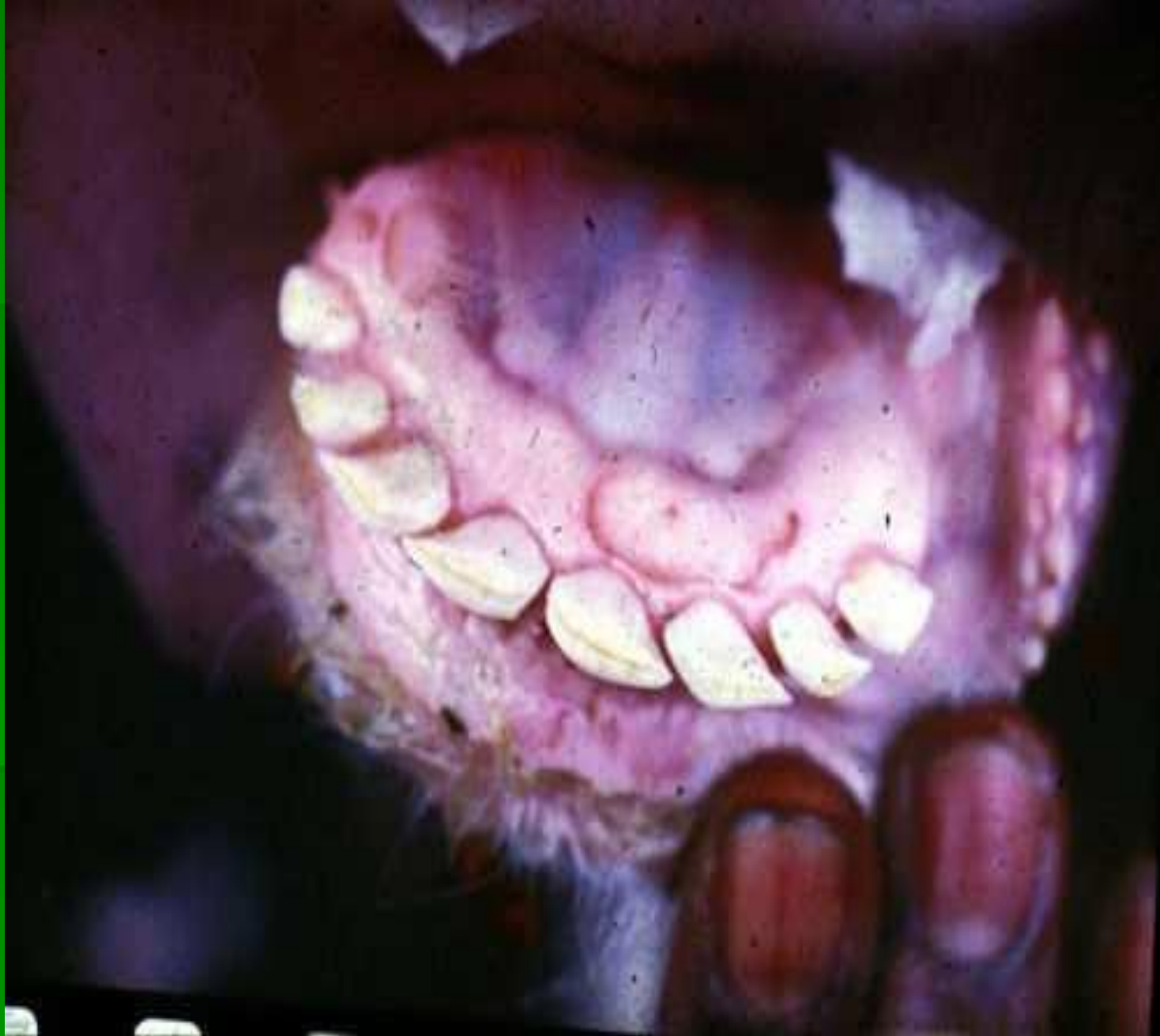
Гингивит, стоматит, кровоизлияния