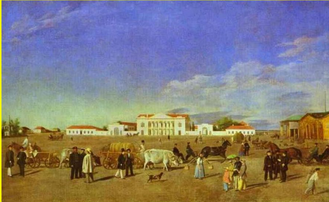
Полтава. Олександрівська площа. Є. Крендовський. 1840