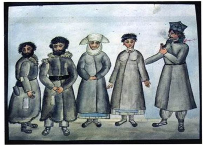
Поселяне Чернобильського и Шенелитського обществъ.

На основі поданих малюнків визначте, яким був одяг українців у 18 – на початку 19 ст.