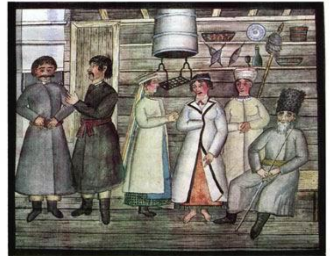
Поселяне Старо Пешовського и Дымерського обществъ.