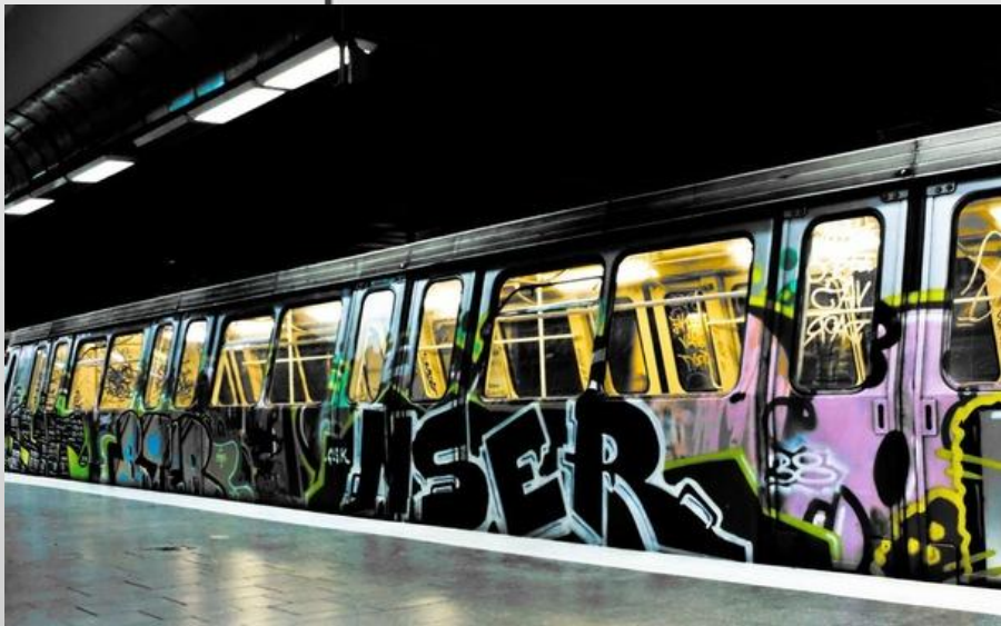
Один из поездов в Нью-Йоркском метро