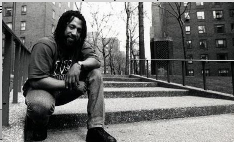
Dj Kool Herc

Хип-хоп зародился в афроамериканской и латиноамериканской среде Бронкса, района Нью-Йорка, 12 ноября 1974 г. В то время это была музыка для вечеринок, которую создавали диск-жокеи (называемые сокращённо «диджеями»), работавшие в крайне примитивной тогда технике семплирования: она зачастую сводилась к повторению музыкального проигрыша чужой танцевальной композиции. Первые эм-си были буквально типичными конференсье («Master of Ceremony» — то есть сокращённо MC; эта аббревиатура затем вобрала в себя множество других значений), они представляли диджеев, а также поддерживали внимание аудитории энергичными возгласами и целыми тирадами.