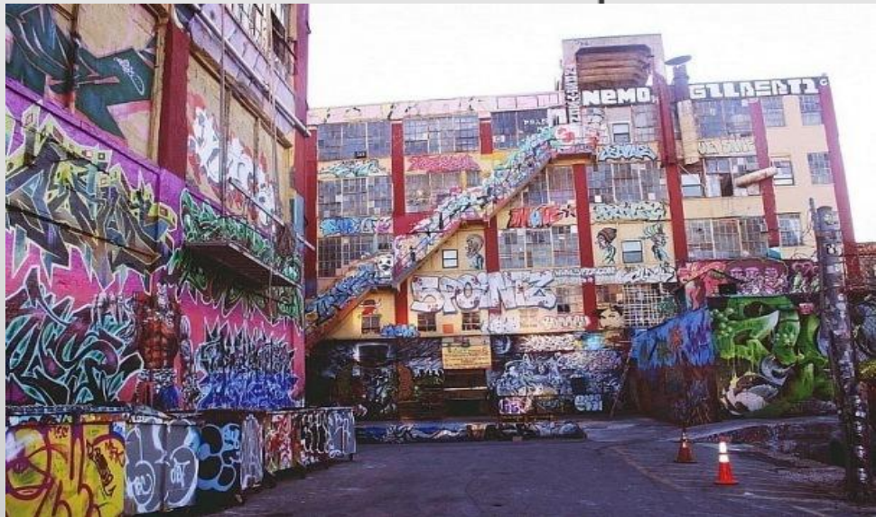
Заброшенный склад в Лос-Анджелесе. Снесено.