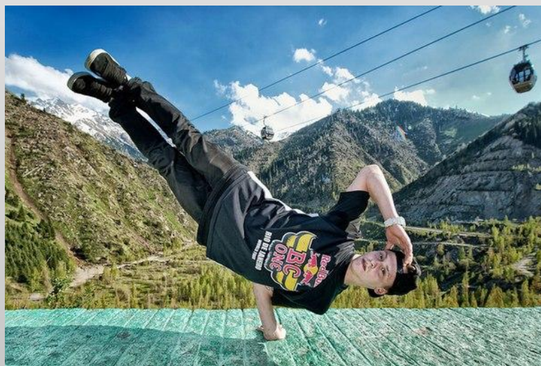
Alcolil (Брейк Данс. Россия. Сибирь)