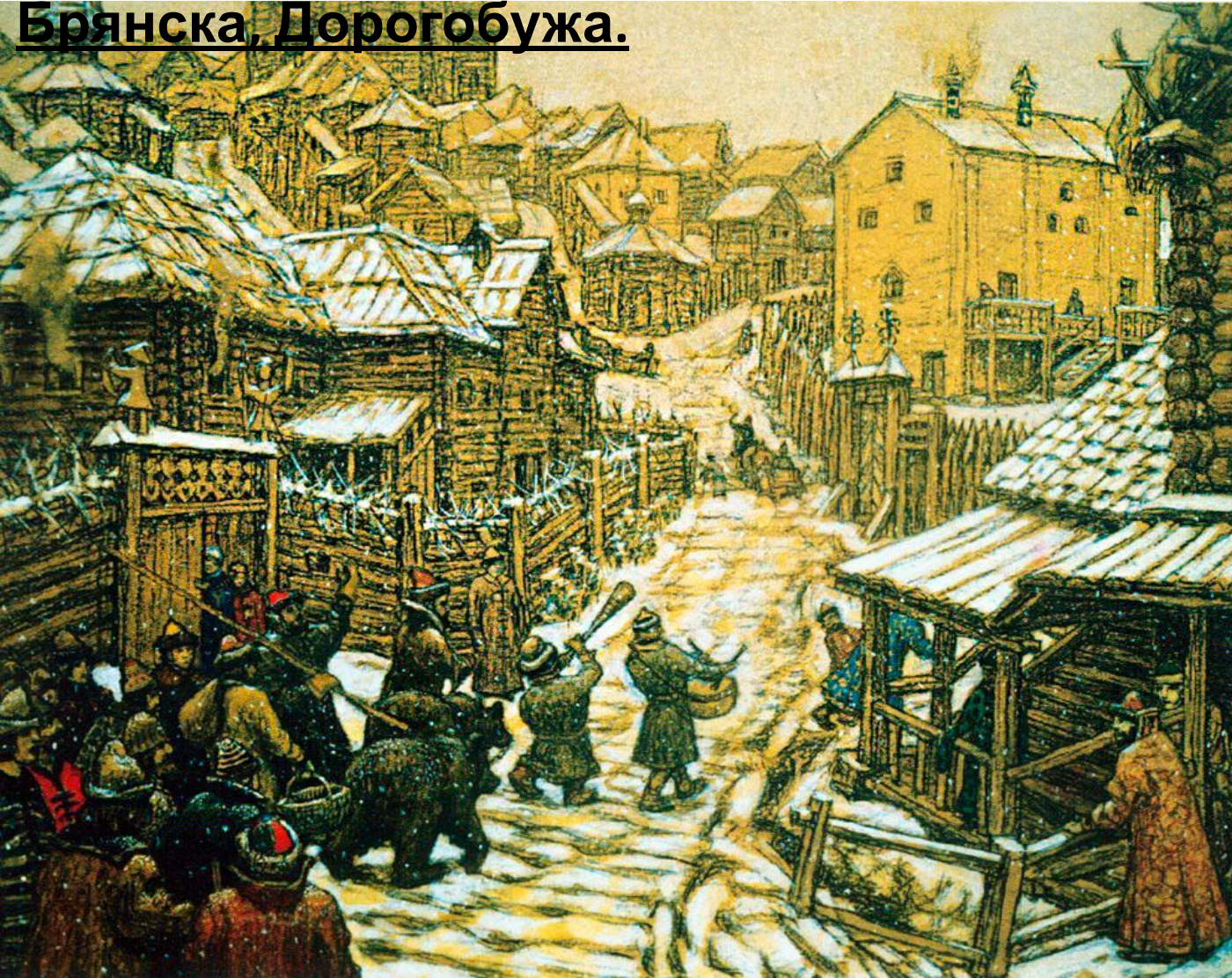
Деревянная Москва времен Ивана III