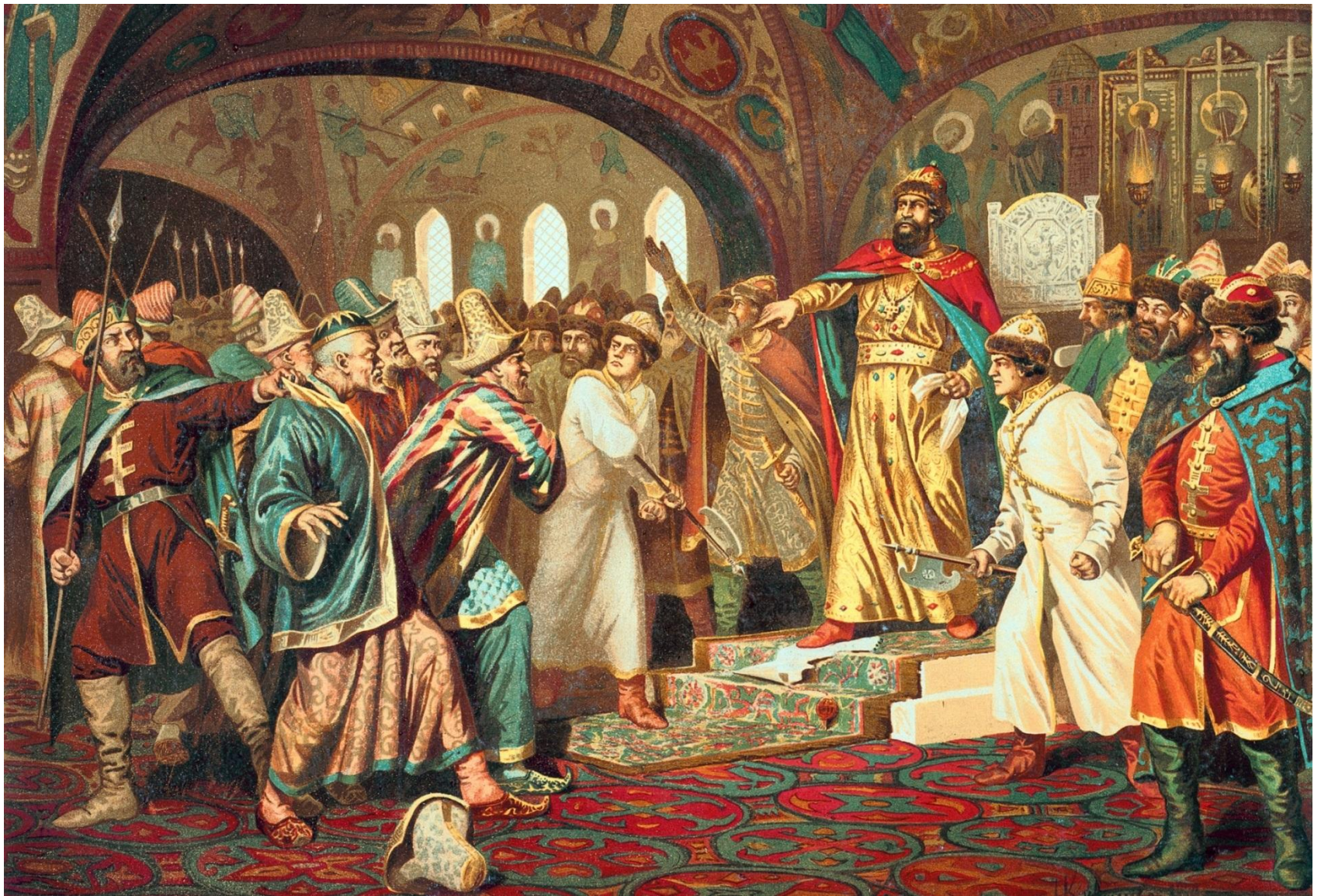
Иван III разрывает ханскую грамоту перед татарскими послами