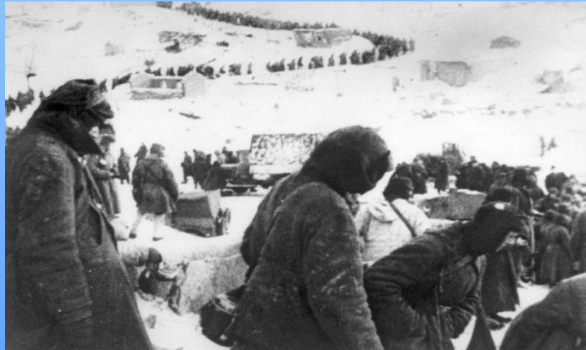
Сталинградская битва (колонна пленных немцев)

10 января 1943 года советские войска приступили к осуществлению операции «Кольцо». Сталинградская битва вступила в свою завершающую фазу. Прижатая к Волге и рассечённая на две части вражеская группировка вынуждена была сдаться.