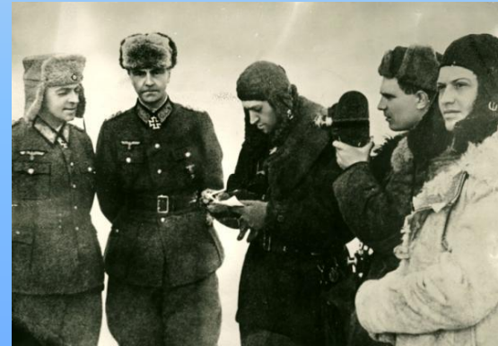
Сталинградская битва. Пленный Ф. Паулюс (он надеялся, что его обменяют, и только в конце войны узнал, что его предлагали обменять на сына Сталина - Якова Джугашвили).