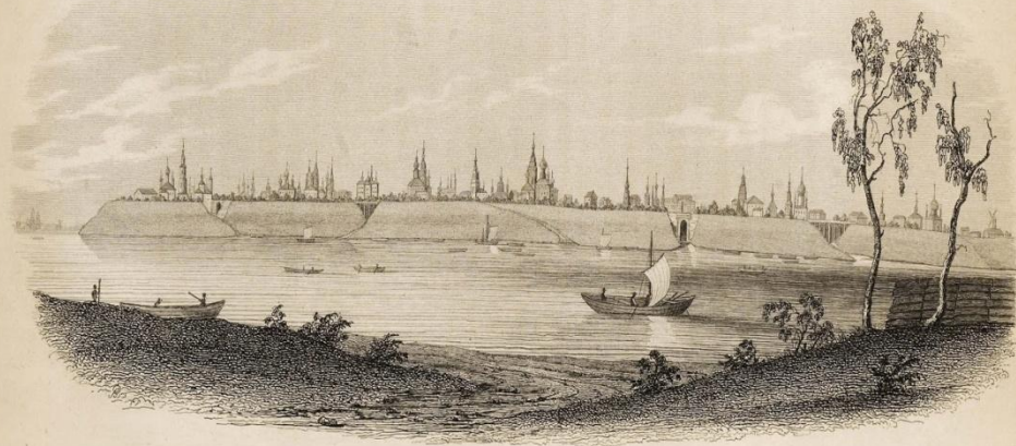
ЯРОСЛАВЛЬ. Ильинская площадь