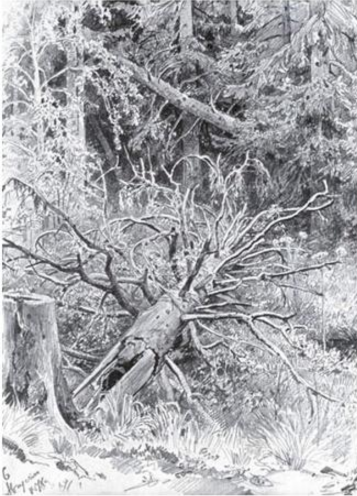
Рисунок И.И. Шишкина «Упавшее дерево»