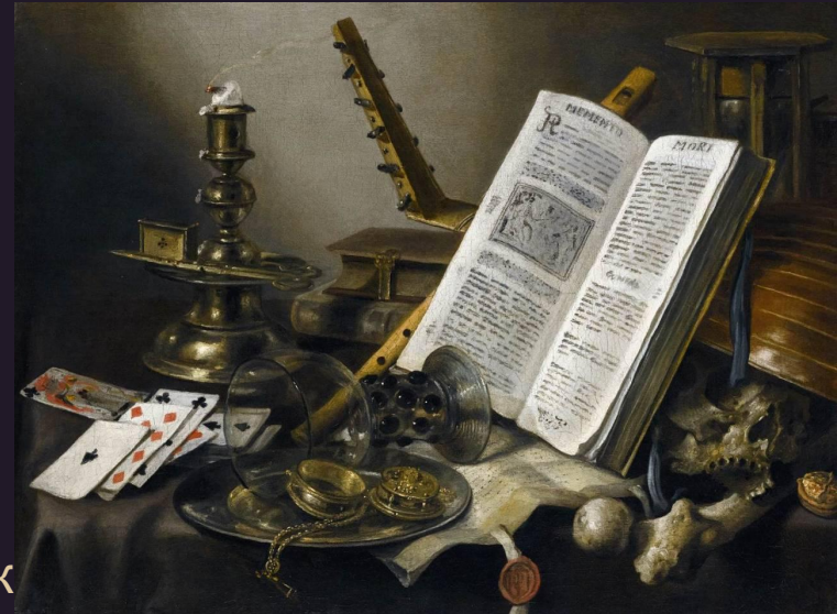
Pieter Claesz (1596-1661)

Кубки, игральные карты или кости - знак ошибочной жизненной цели, поиска удовольствий и грешной жизни.