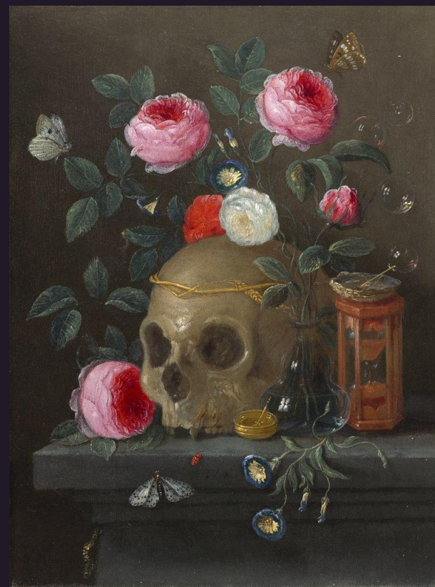
Jan van Kessel (1626-1679)