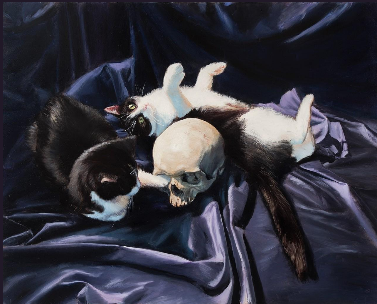
Miroslav Polách «Vanitas» 2015