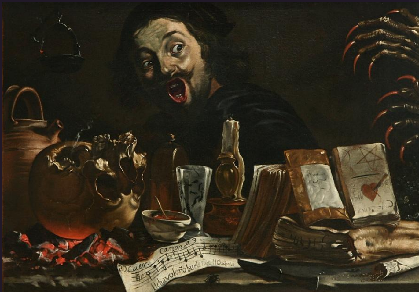
Pieter van Laer

«Мистическая сцена с автопортретом» 1638