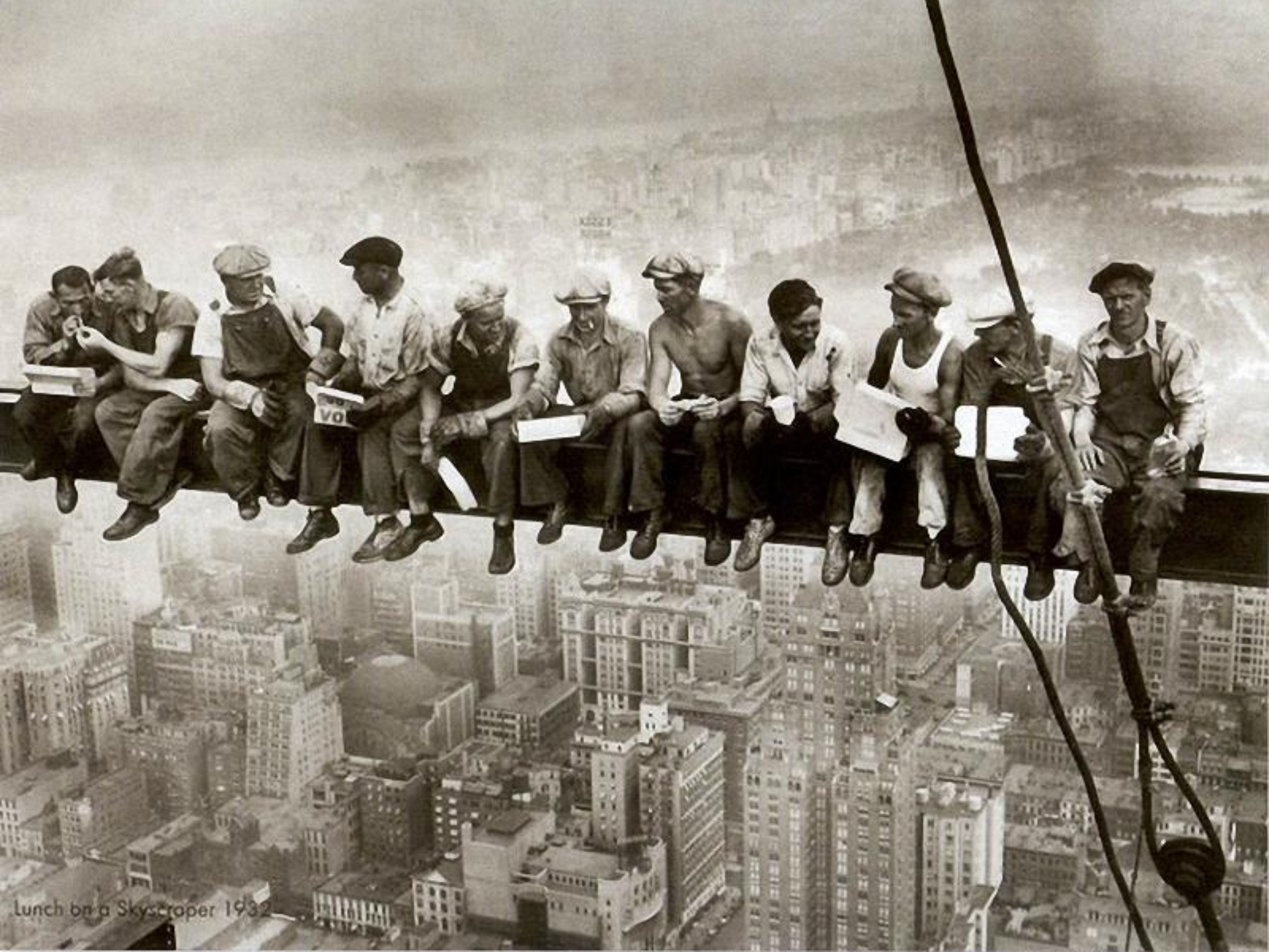
Lunch on a Skyscraper 1932