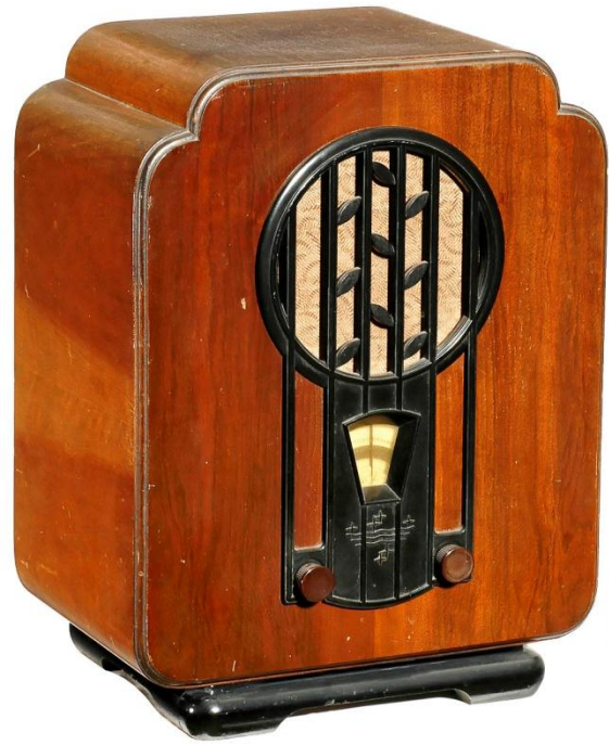
Радиоприёмн УК Philips 930А, 1931 год