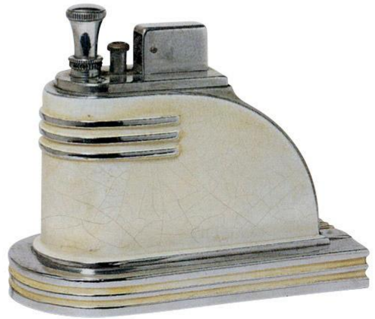
Настольная зажигалка Ronson, 1925