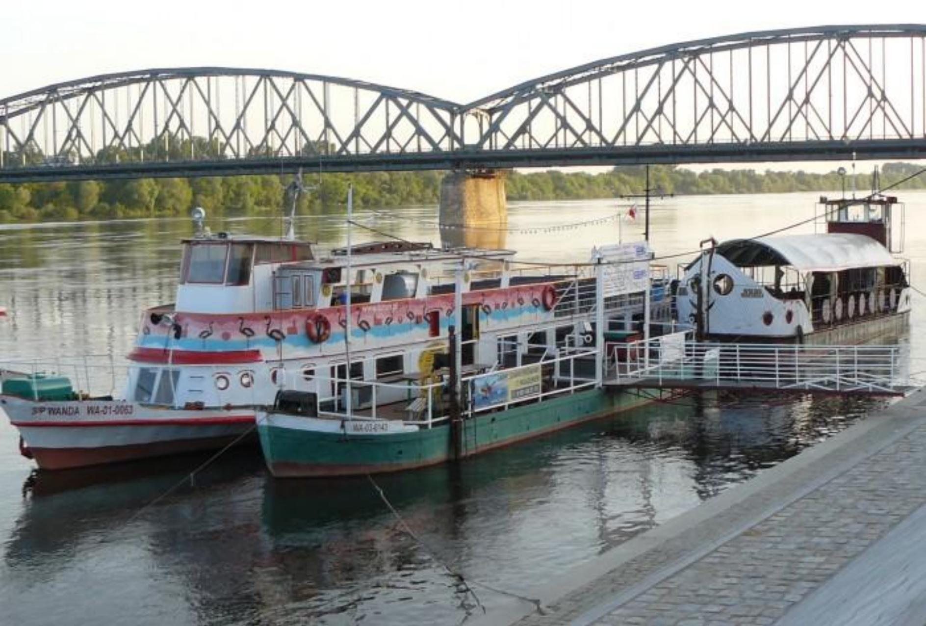
Statki na Wiśle