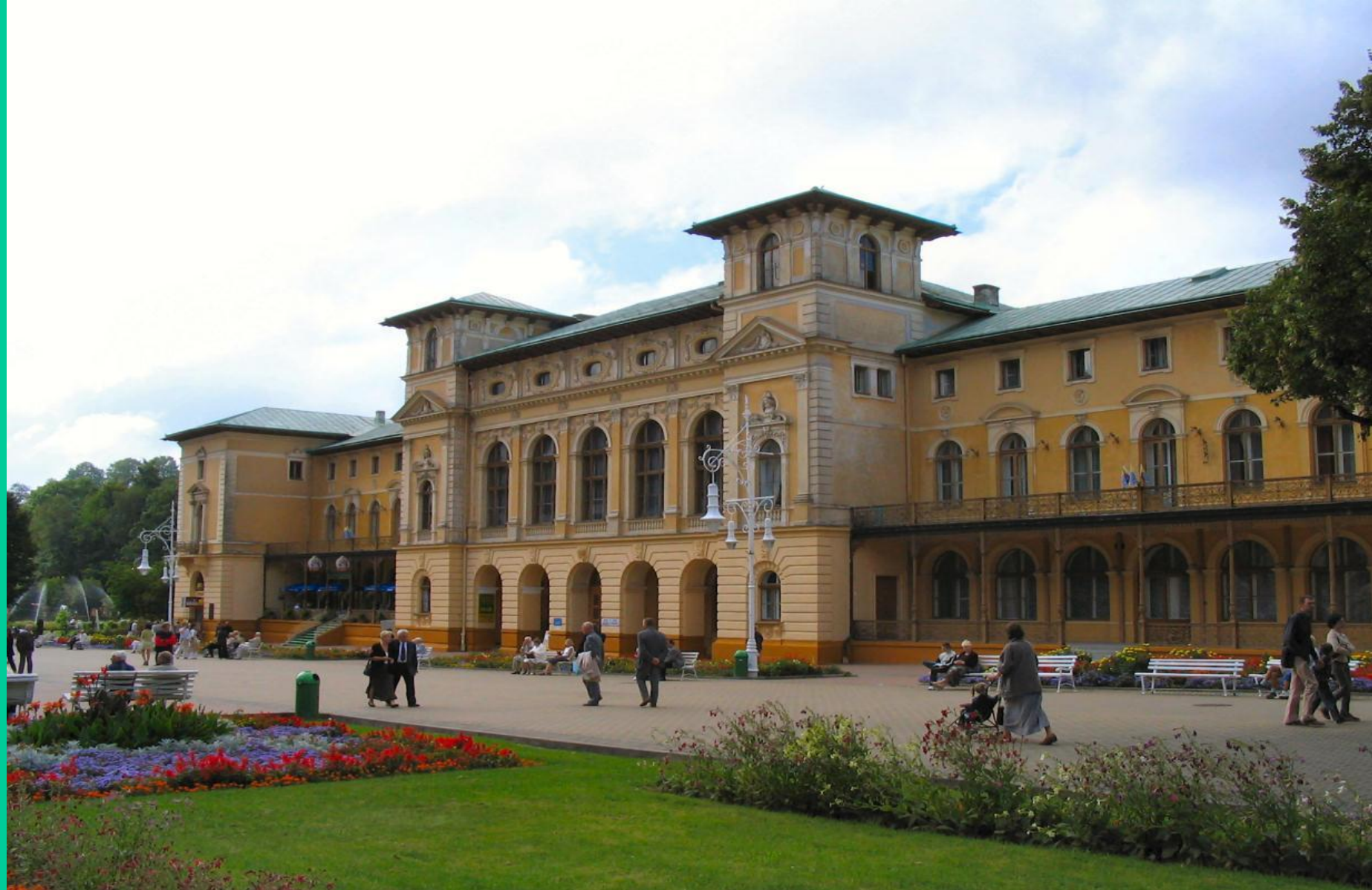
Uzdrowisko w Krynicy Zdrój – Beskid Sądecki