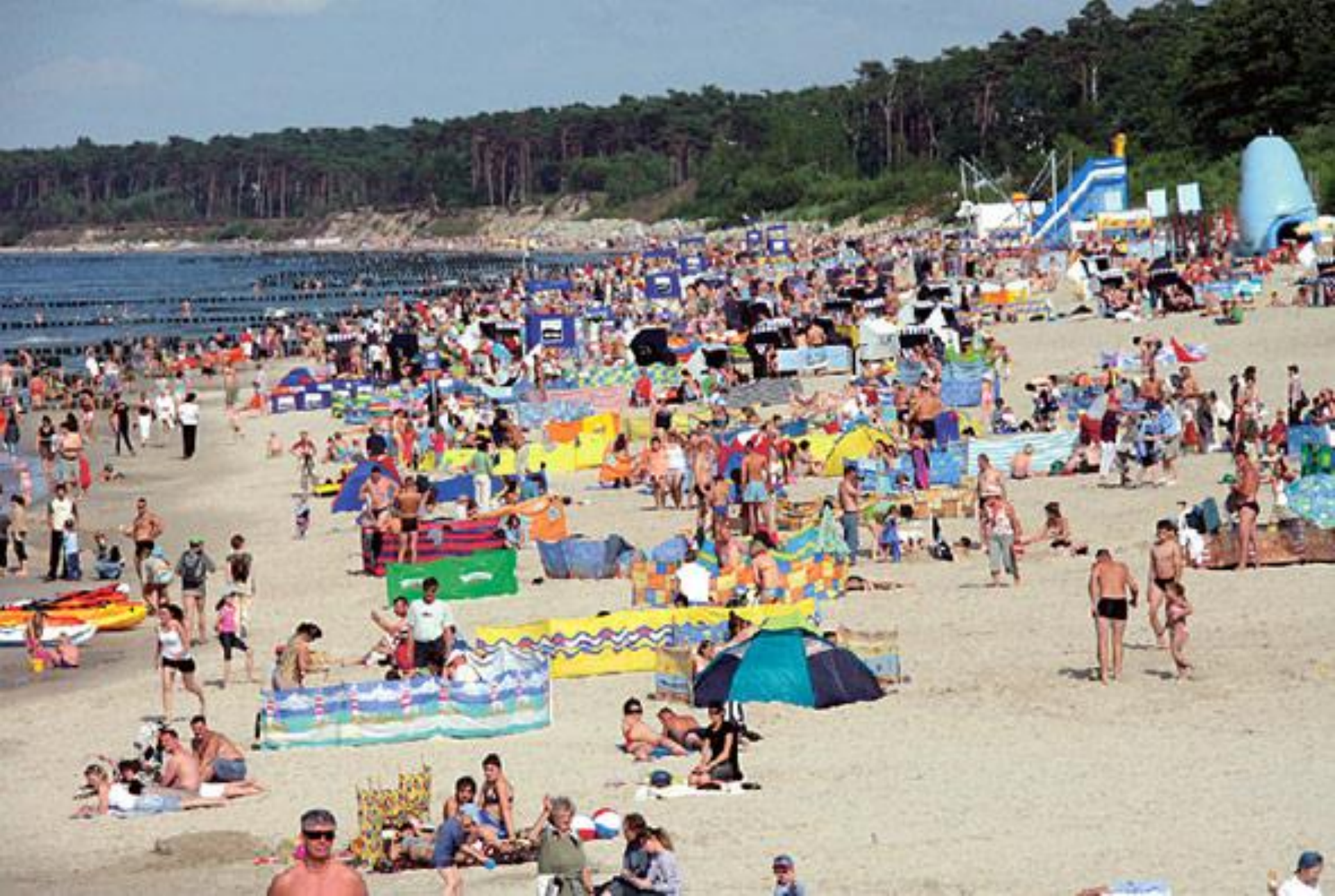
Plaża w Ustce