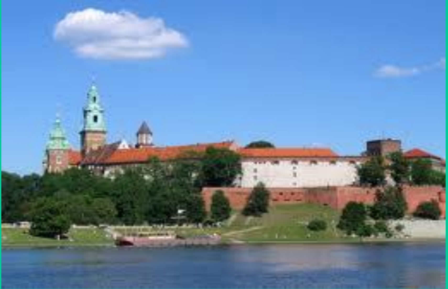
Kraków nad Wisłą