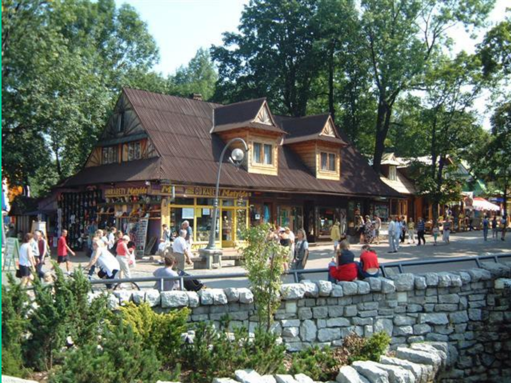
Zakopane – deptak na Krupówkach