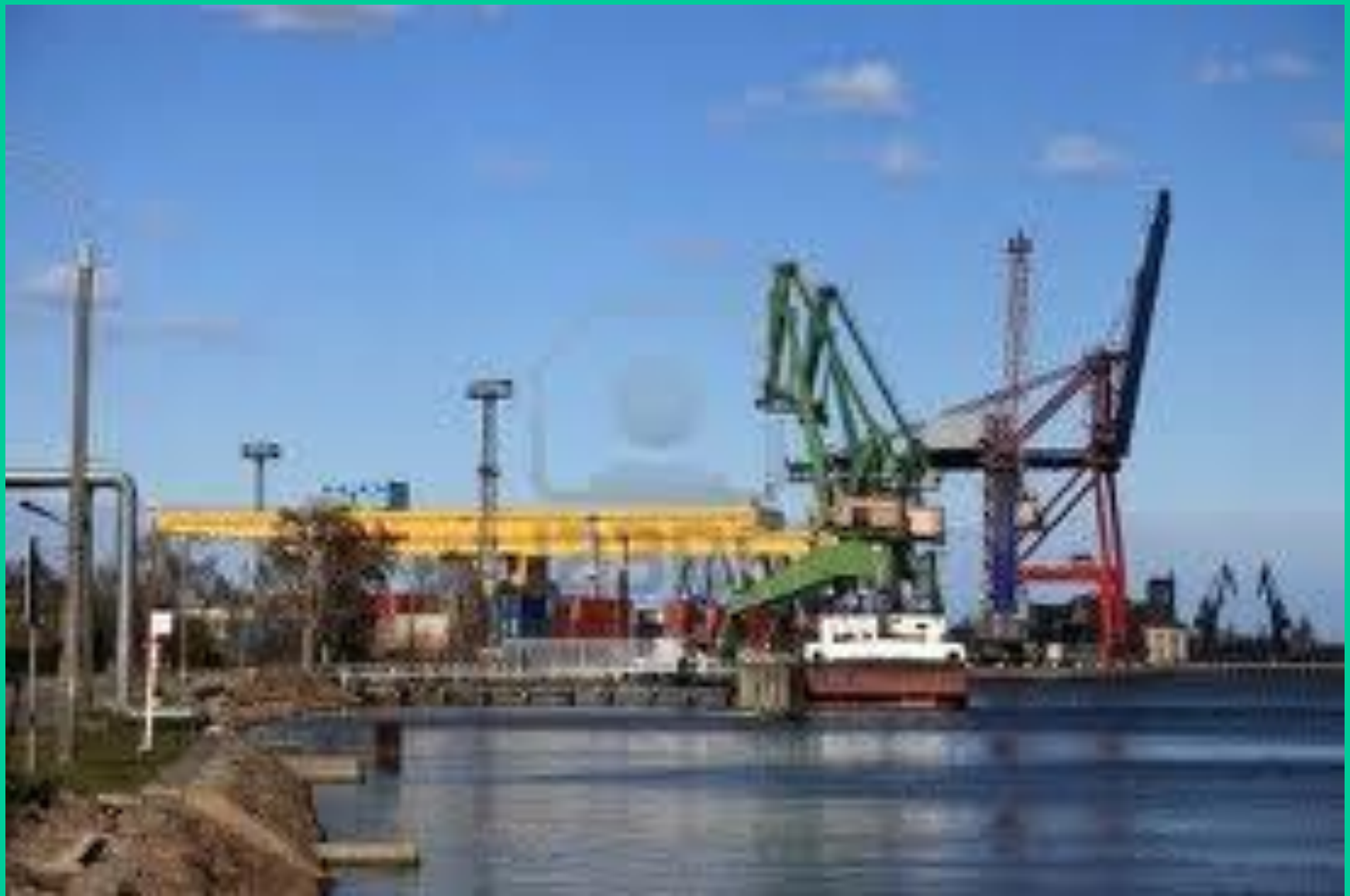
Port w Gdańsku