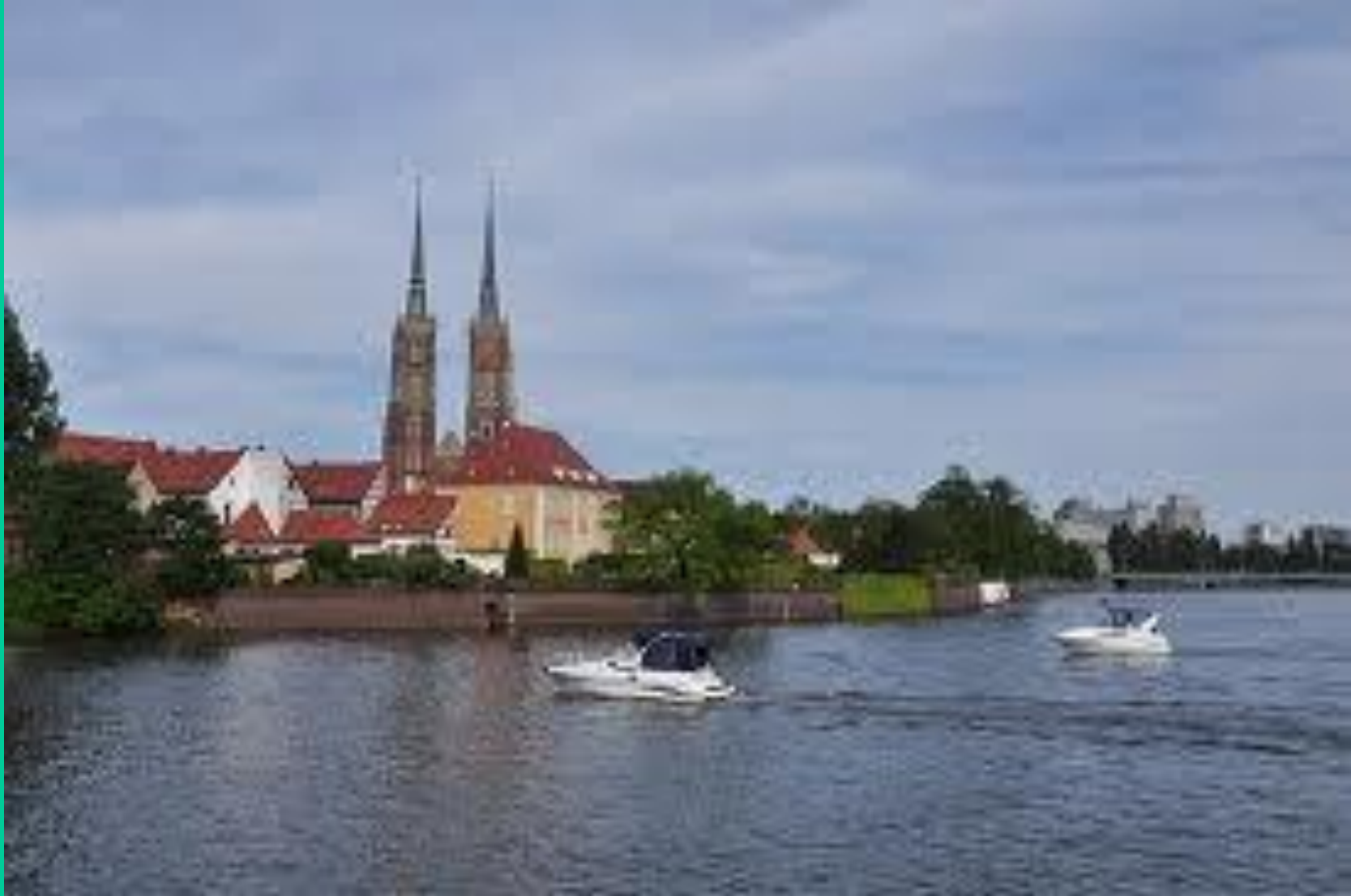
Wrocław nad Odrą