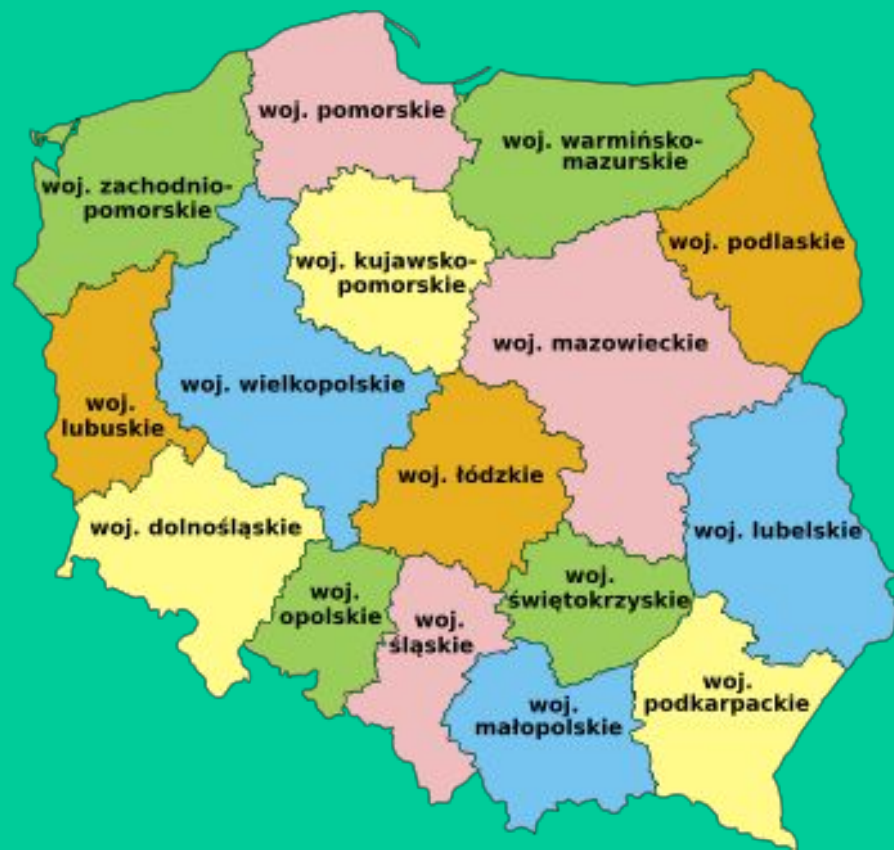
Obecny podział terytorialny Polski - województwa