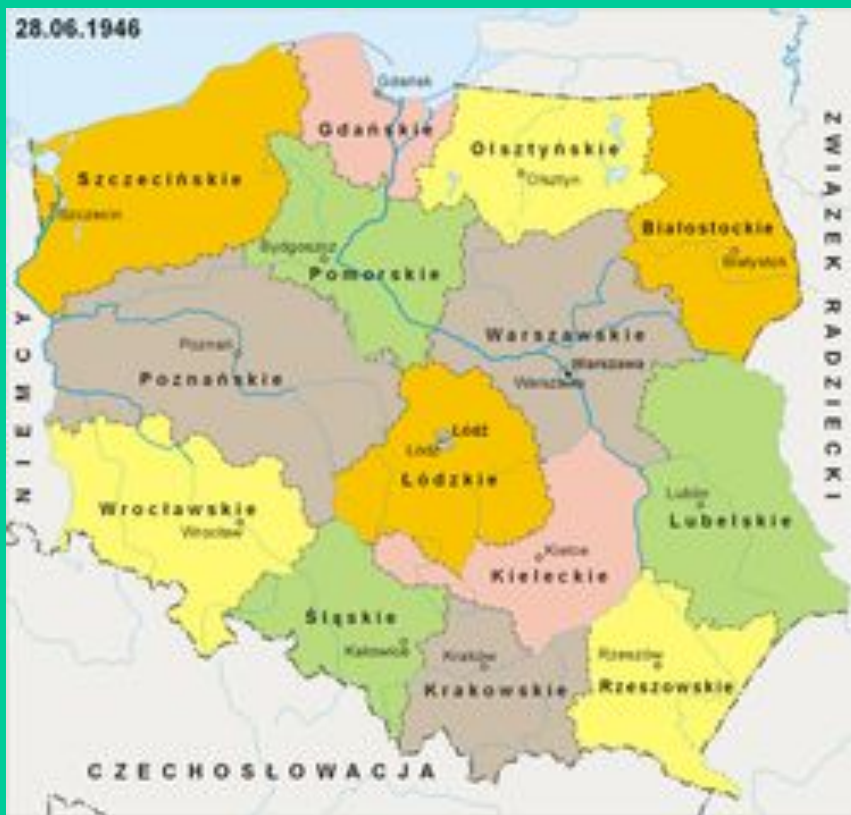
Województwa w Polsce - 1946 rok