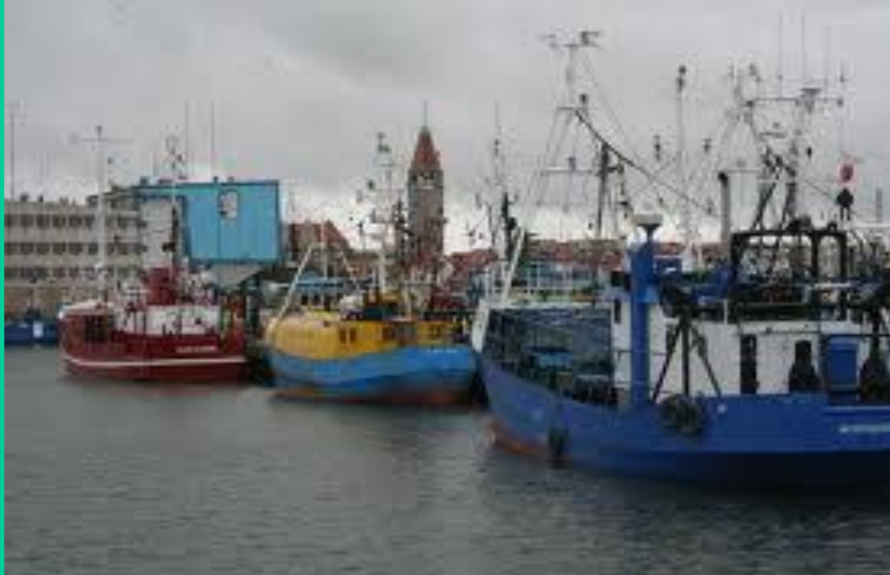
Kutry rybackie - Władysławowo