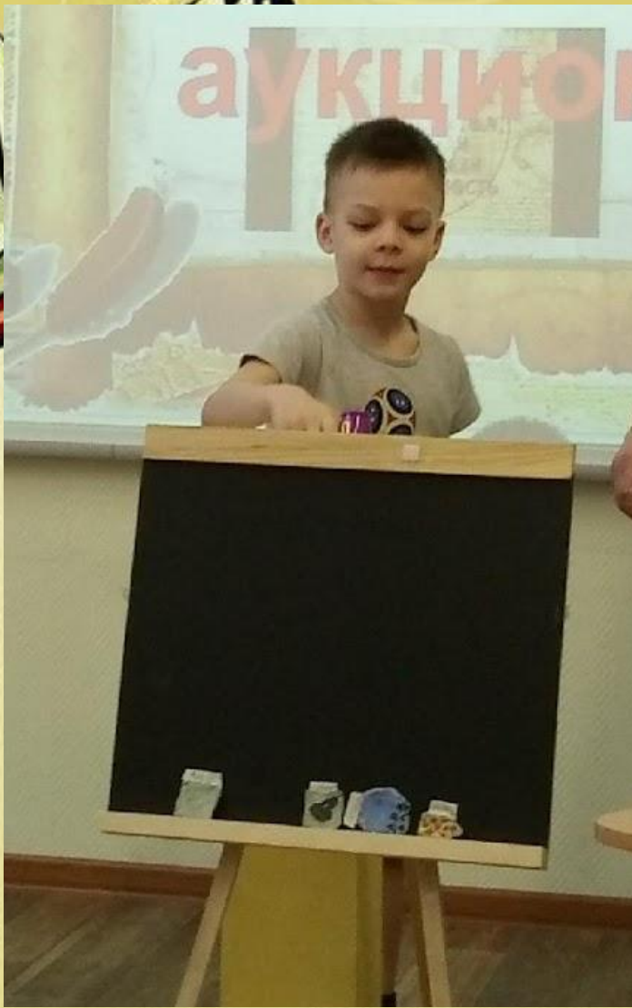
Первый лот выставлен. Аукционист озвучивает цену.