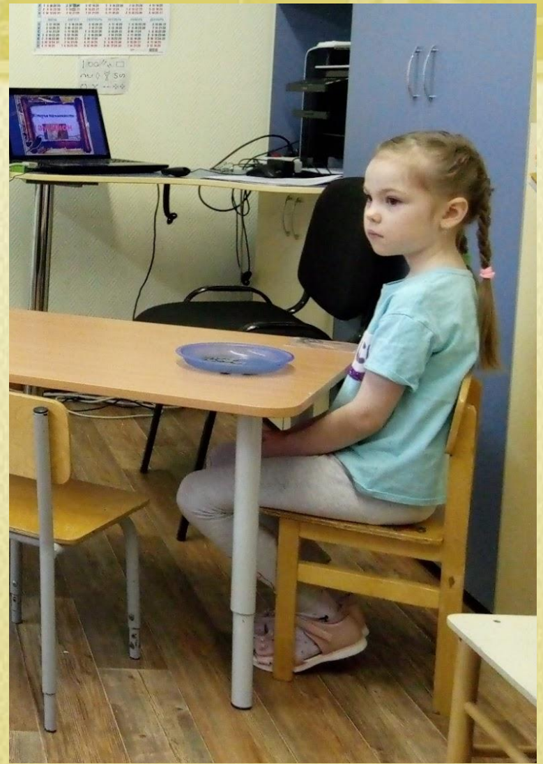
Кассир в ожидании покупателя.