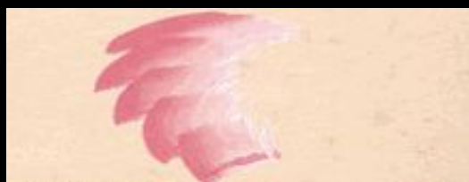
Мазок «в полкисти»