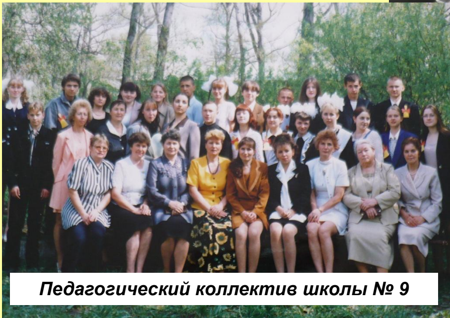
Педагогический коллектив школы № 9