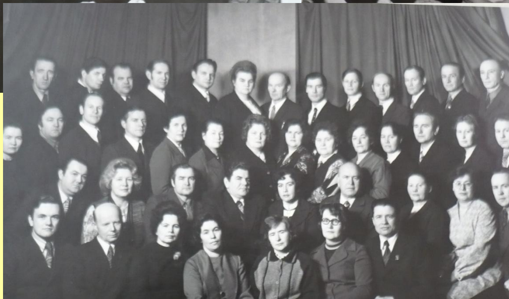
Участники семинара заведующих районными городскими отделами народного образования