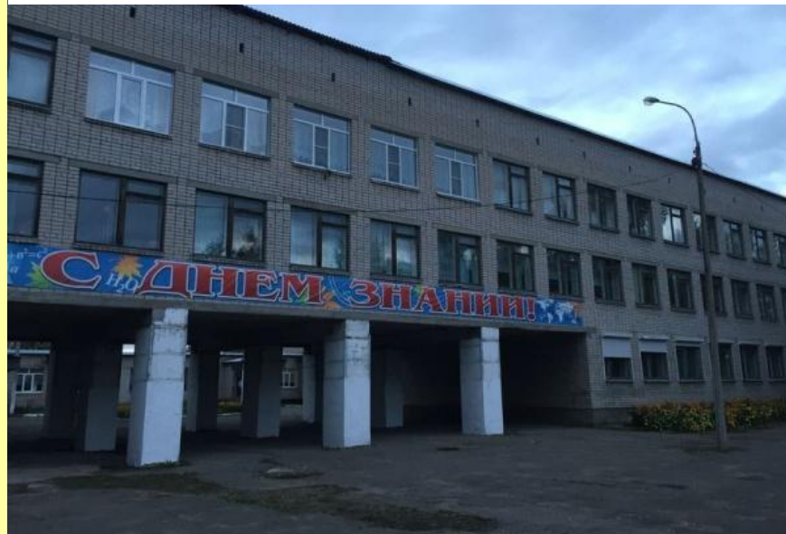
Школа № 3 г.Сокол