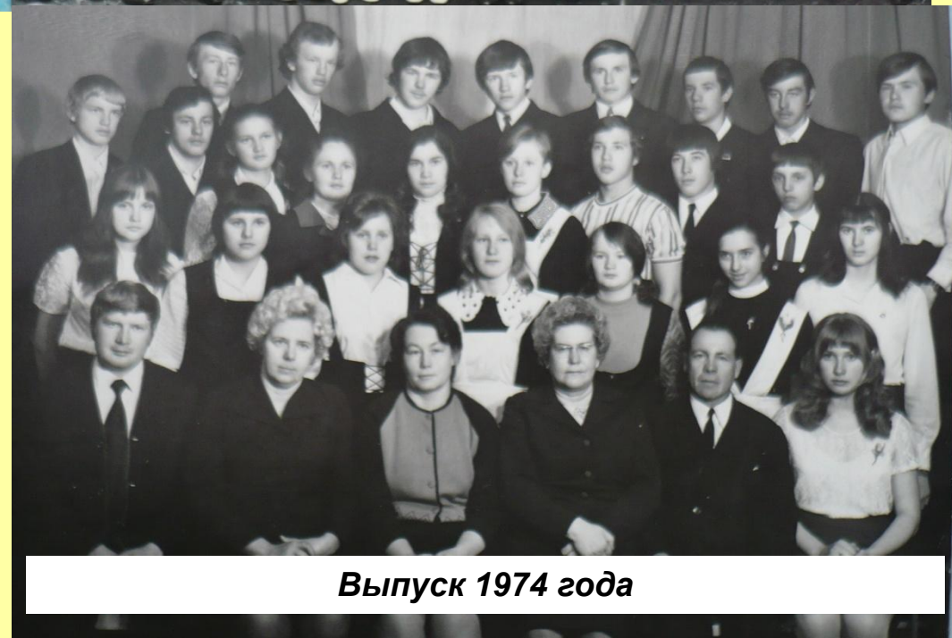
Выпуск 1974 года