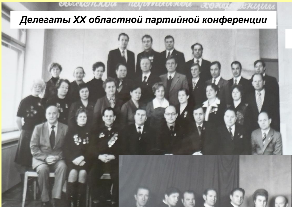
Делегаты XX областной партийной конференции