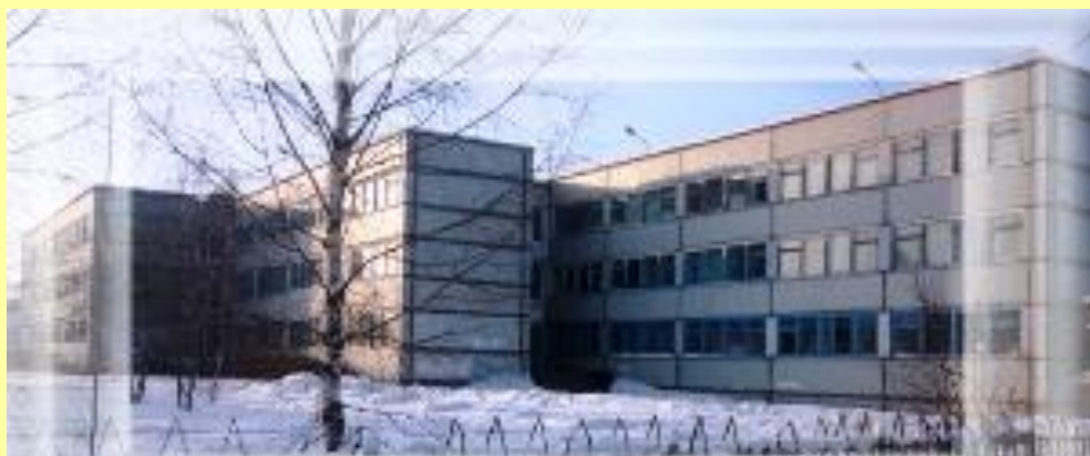
Школа № 5 г.Сокол