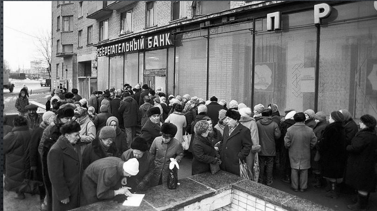
Очередь в сберкассу в Москве (1991)

ФОРМАЛЬНОЙ ПРИЧИНОЙ ДЛЯ ПРОВЕДЕНИЯ РЕФОРМЫ БЫЛА ОБЪЯВЛЕНА БОРЬБА С ФАЛЬШИВЫМИ РУБЛЯМИ, ЯКОБЫ ЗАВОЗИМЫМИ В СССР ИЗ-ЗА РУБЕЖА.