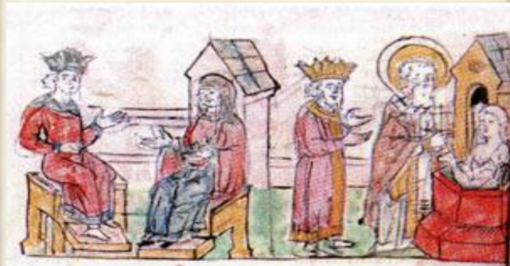
VI. Княгиня Ольга на приеме у императора и ее крещение.