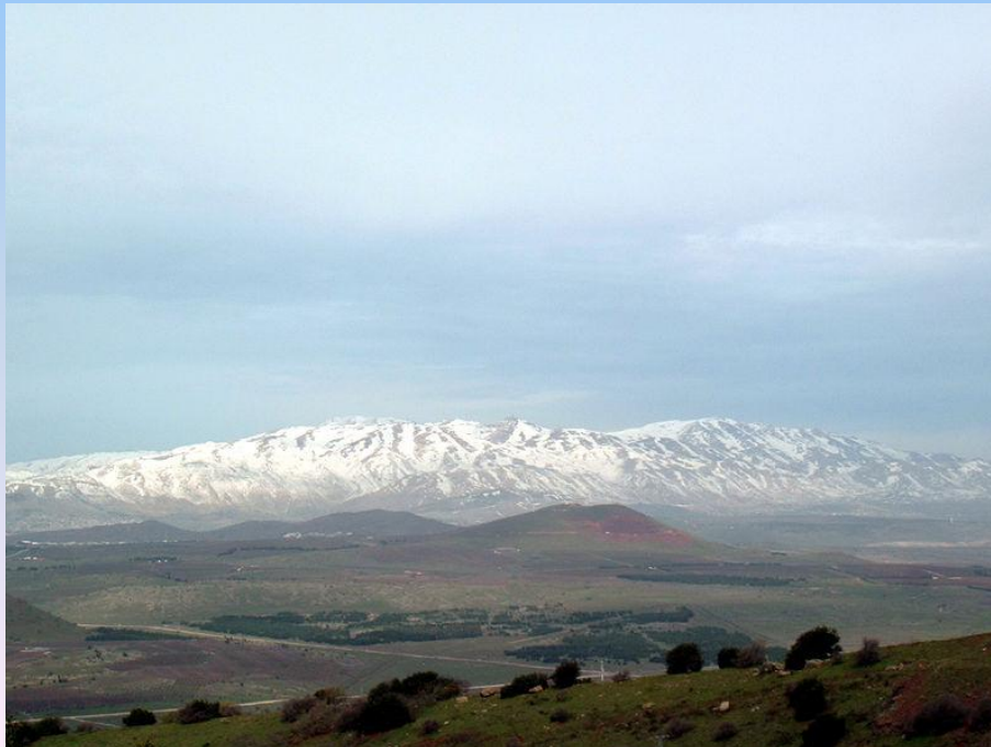
Израильская вершина горы Хермон — вид с горы Бенталь

Туризм, в особенности паломничество, также является важной статьёй доходов Израиля. Благодаря жаркому климату, достопримечательностям и уникальной географии — от заснеженной вершины горы Хермон, где расположена горнолыжная база, и лесов Галилеи до сафари в Иудейской пустыне и пустыне Арава Израиль привлекает большое число туристов. В 2008 году количество туристов, посетивших страну может превысить 2,8 млн человек.