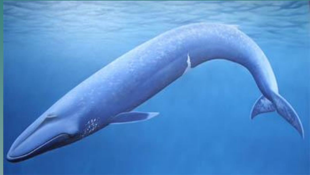
Усатые Китообразные. Синий кит.