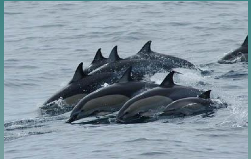
Зубатые Китообразные. Дельфины