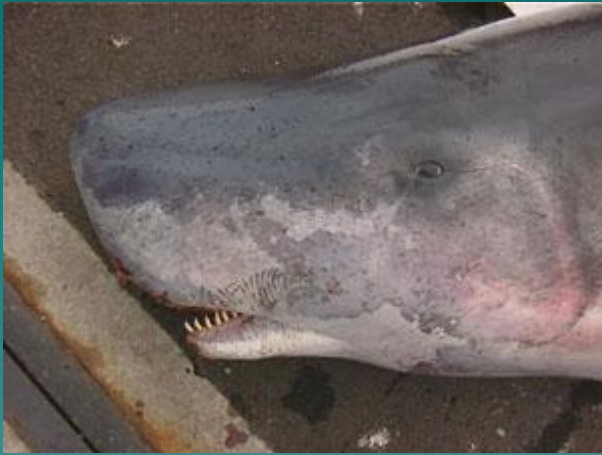
Зубатые Китообразные: Кашалот