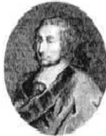
Блез Паскаль Гравюра