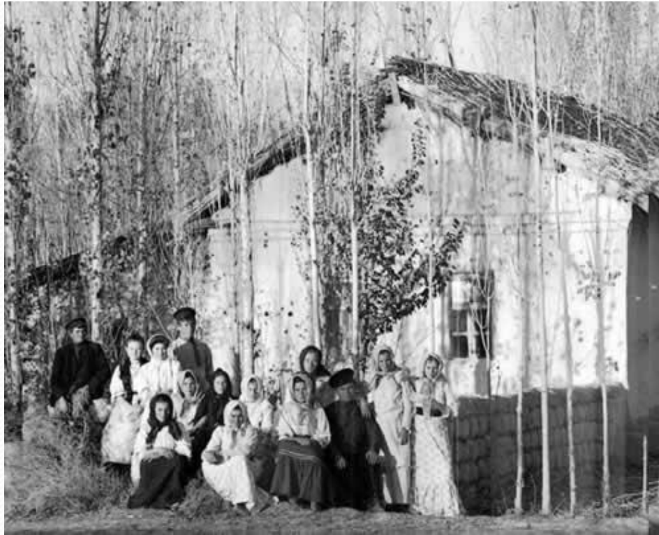
Русские переселенцы в Самаркандской губернии Туркестанского генерал-губернаторства.

● Важнейшим направлением реформы стала переселенческая политика. Борясь с перенаселением в центре страны, Столыпин стал раздавать земли в Сибири на Дальнем Востоке и Средней Азии предоставляя переселенцам льготы (освобождение на 5 лет от налогов и воинской службы). Но местные власти отнеслись к этому враждебно. Почти 20% переселенцев возвратились назад. Правда население восточных районов все же заметно увеличилось.