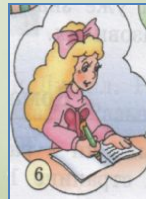
Alice is ...